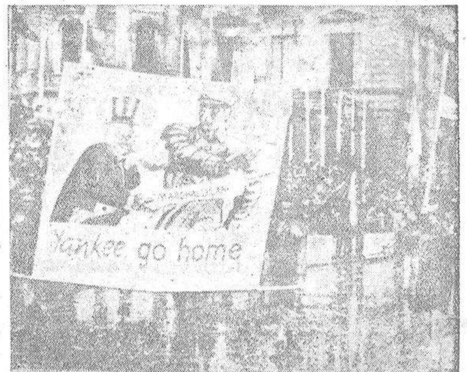
Los jóvenes comunistas desfilaron por las calles del sector oriental de Berlín portando carteles ofensivos para los occidentales. En la foto se ve uno en el que se desprecia al capitalismo yanqui y se le invita a regresar a su casa.