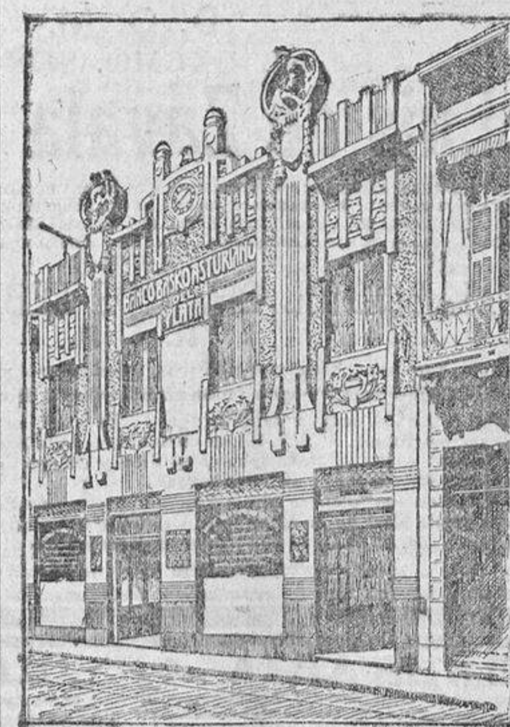
EDIFICIO DEL BANCO

BUENOS AIRES.—Calle Maipú, 73 al 87. Casilla de Correos, 619