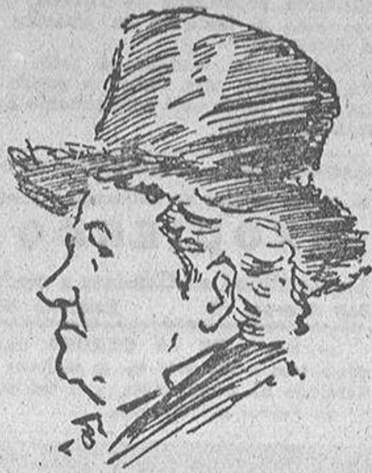
Autoretrato de Goya

Todo lo que proyecta nuestra primera autoridad municipal es de suma interés, pero lo apuntado no lo es menos. Por eso conviene que se amplie ese presupuesto y se proponga ya el procedimiento a seguir en las obras. Por ejemplo, por concurso. No se le ocurra don Alfonso, hablar, ni de destajos, ni de subvenciones. Antes es preferible tocar para.