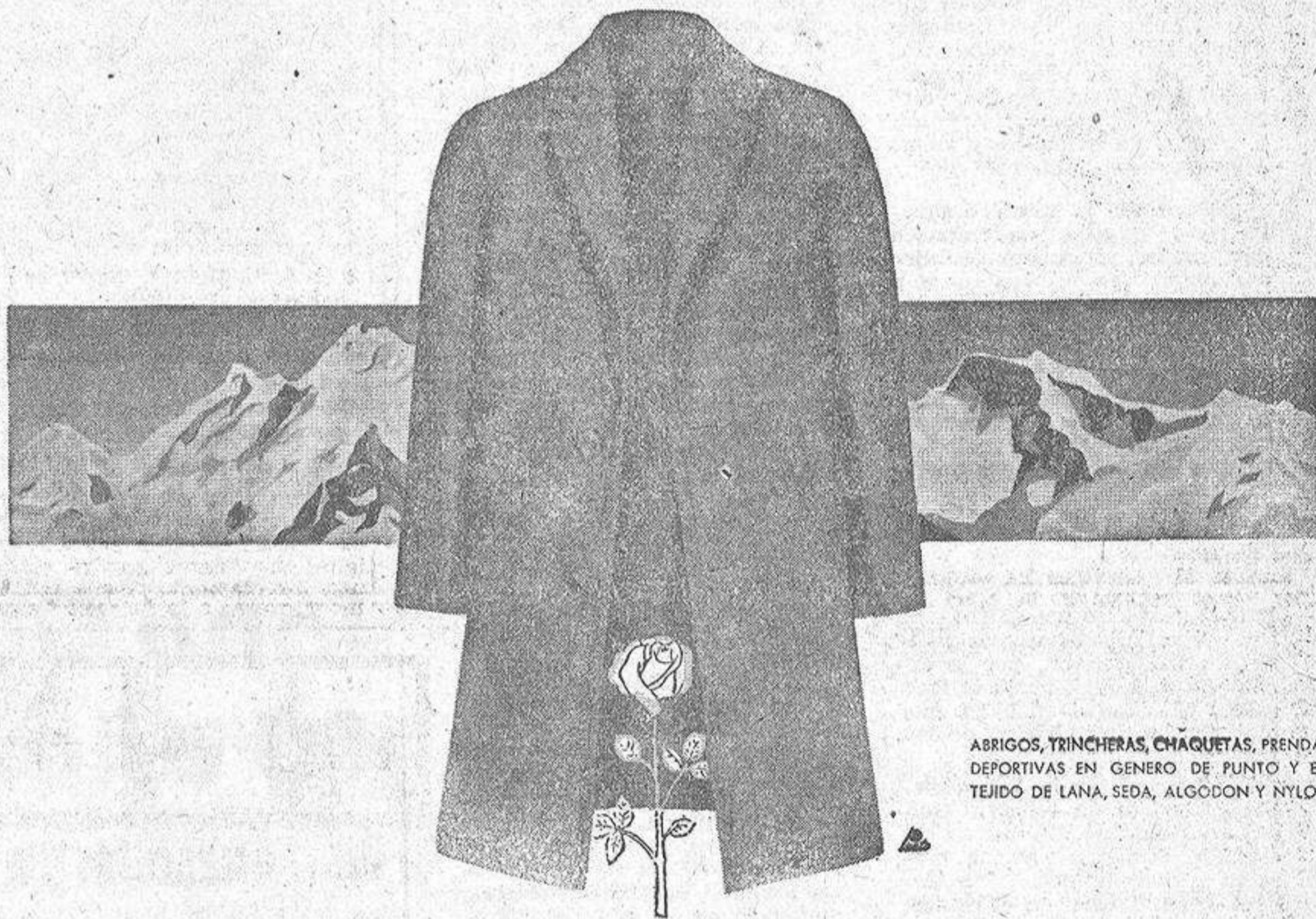
ABRIGOS, TRINCHERAS, CHAQUETAS, PRENDAS DEPORTIVAS EN GENERO DE PUNTO Y EN TEJIDO DE LANA, SEDA, ALGODON Y NYLON