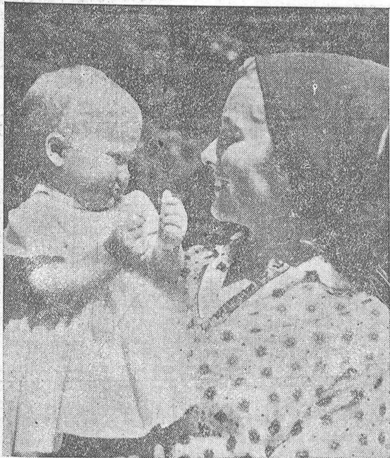
Paola, sonriente, sostiene en los brazos a su hija Astrid, que na cumplido un año. Los Príncipes de Lieja saldrán pronto de vacaciones, y en ellas Paola piensa conducir sola un automóvil de pequeña cilindrada. "De este modo—dice recordando el accidente que acaba de sufrir—iré despacio. Ello no me fatigará y me servirá de distracción dado el estado en que me encuentro". La Princesa espera alumbrar un hijo en el próximo octubre