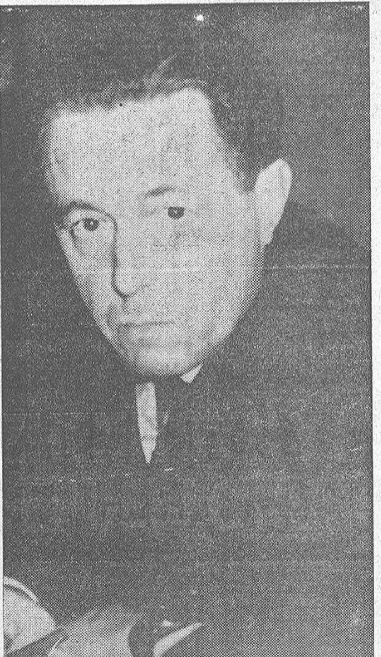
Foto reciente de Alexander Solzhenitsyn, novelista ruso galardonado con el Premio Nobel.

El marxismo se propone dar dignidad al hombre mejorando sus condiciones económicas; el cristianismo afirma que el hombre alcanza esa dignidad a través de la penitencia, la cual conduce a la pureza interior. En la práctica, el comunista valora más a la "colectividad" que al individuo, mientras que el cristiano invierte los términos en su valoración. En ambos sentidos puede decirse que