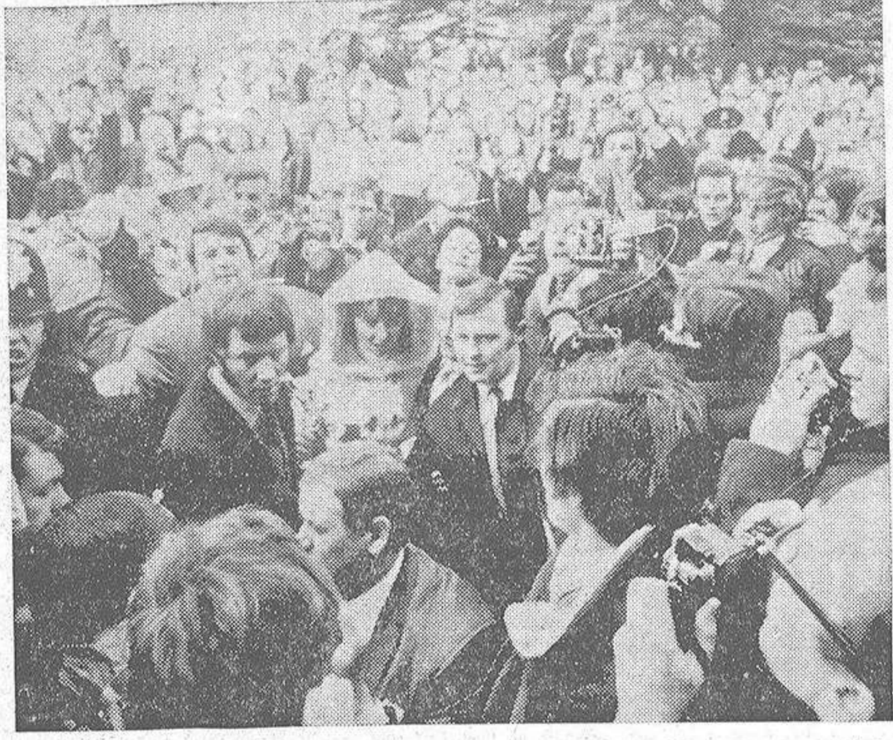
Los "fans" se arremolinan en torno a la cantante negra Lulú, al llegar al atrio del templo donde iba a contraer matrimonio con Maurice Gibbs, componente del conjunto "Bee Gees".

Lulú, que en la vida real se llama nada menos que Marie Mac Donald-Cac Laugham Lawrie, se