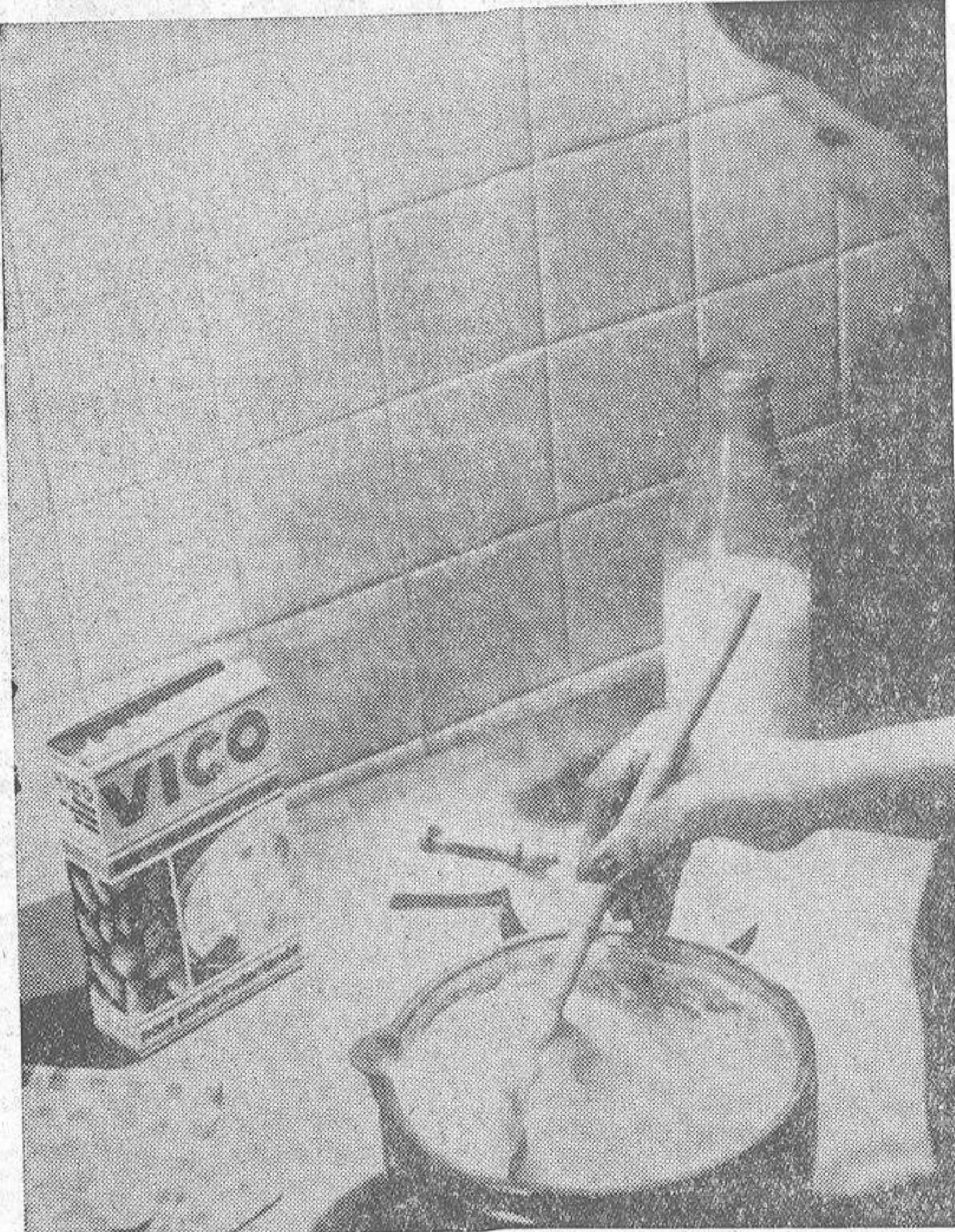
En la espera del "polvo de palmito" y los "copos de pollo" el puré de patata en polvo permite una preparación instantánea.

En Escocia se manifiesta un interés creciente por los "flavours". Una técnica única en su género permite la medida sensorial y la descripción de los aromas de los productos. Esta ciencia abre amplios horizontes no solamente a la industria de la alimentación, sino igualmente a los fabricantes de