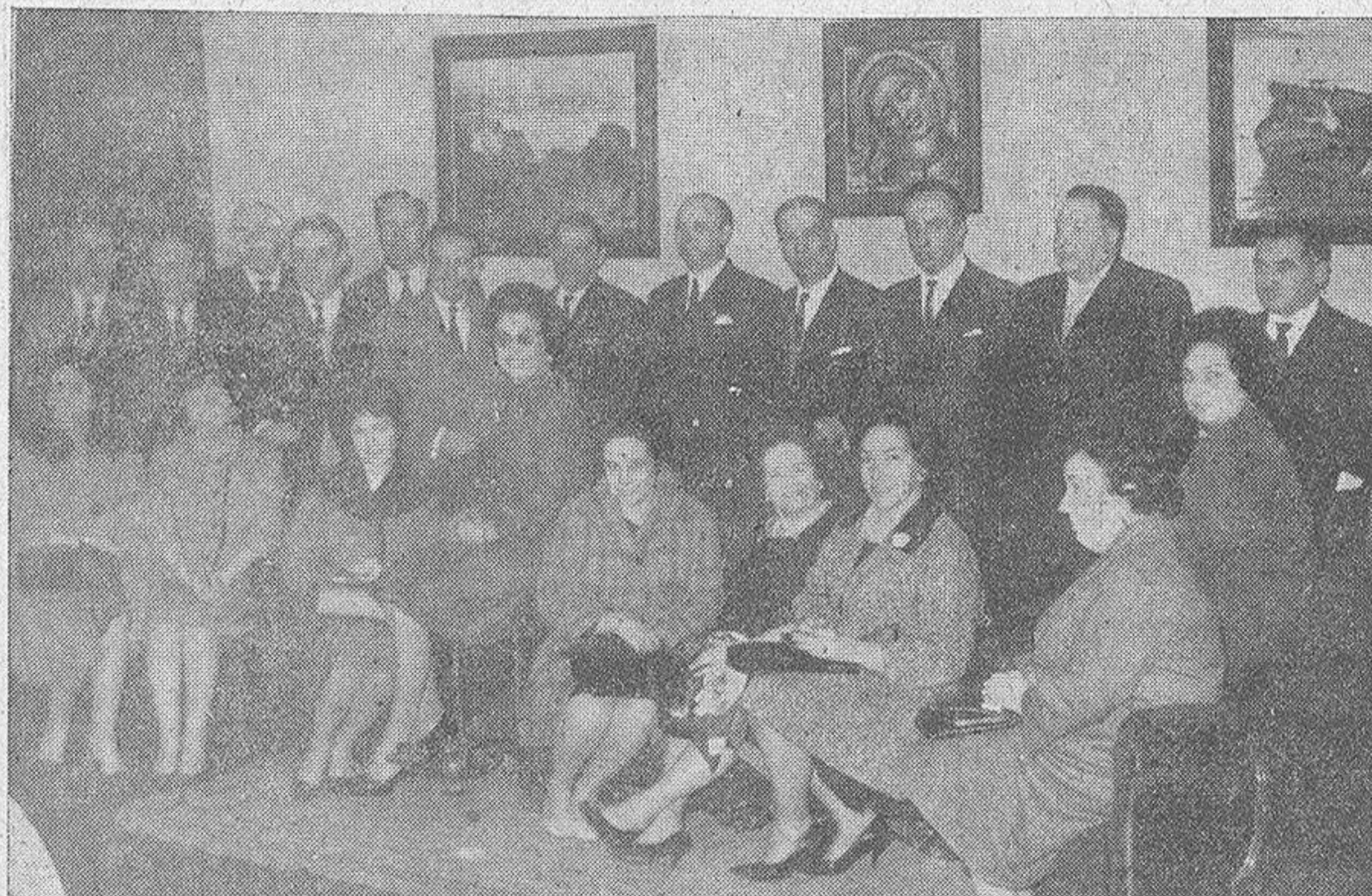
Grupo de asistentes a la recepción celebrada en la noche de ayer, en la Asociación de la Prensa de La Coruña, en honor de los periodistas lusitanos que asisten a la Semana Cultural Galaico-portuguesa que se celebra en Santiago.

Poco antes de las siete de la tarde de ayer, llegaron a La Coruña, por carretera, un grupo de periodistas y escritores portugueses que procedían de