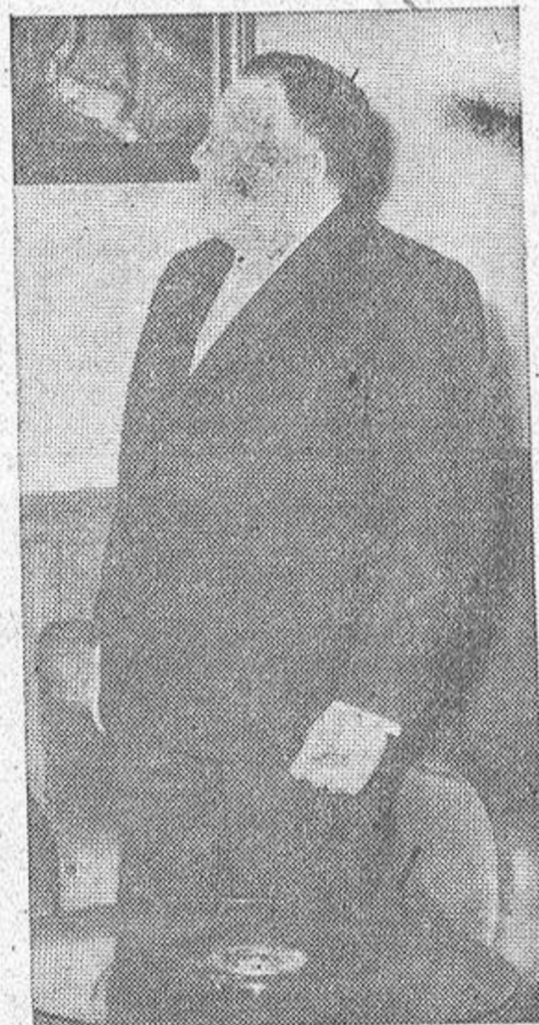
El Presidente de la Asociación de la Prensa y director de la HOJA DEL LUNES de La Coruña, durante la salutación que dirigió a los periodistas portugueses.