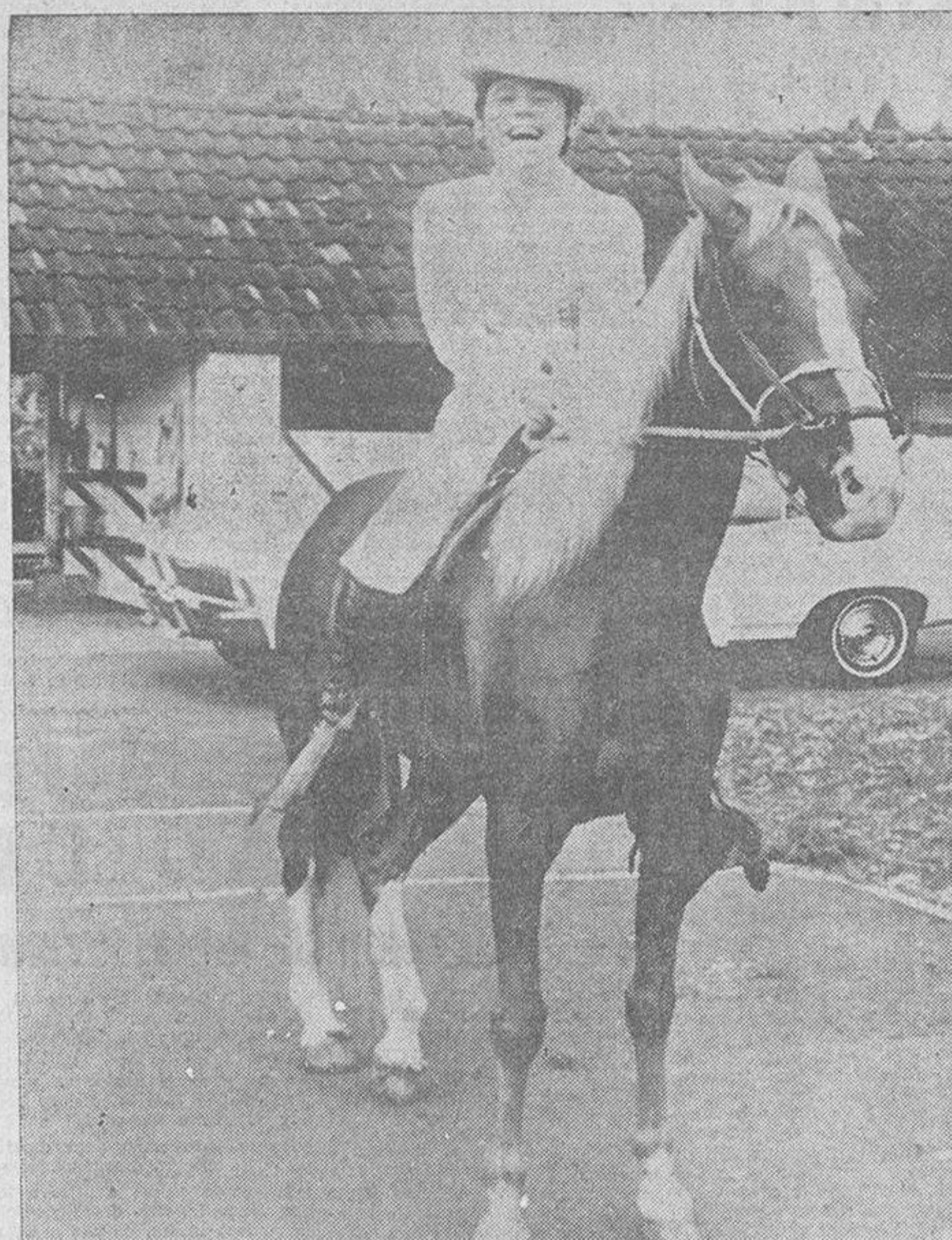
He aquí a Raphael, el ídolo español de la canción, que ha triunfado rotundamente en Nueva York.

La celda es cómoda, sin embargo, habitación 4631, con detalles del hotel en la puerta, y en los pasillos para impedir la entrada de cazadores de autógrafos. Es