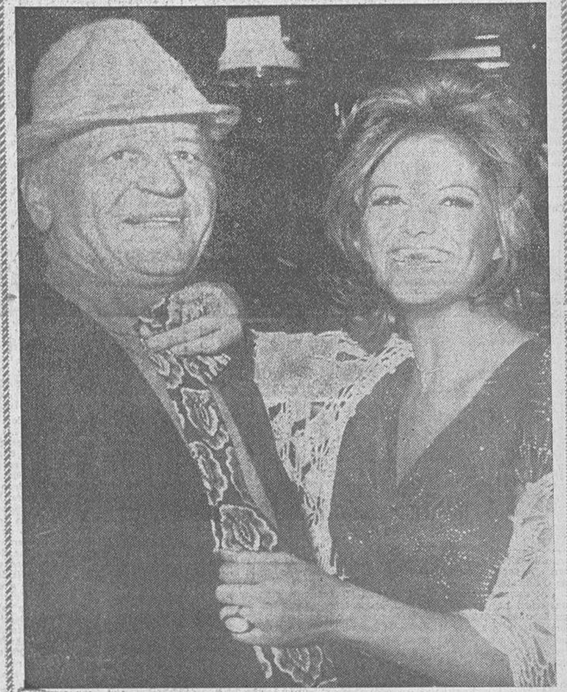
En París fue obtenida, días atrás, esta foto en la que aparecen Henri Charrière más conocido como "Papillon" en compañía de la actriz Claudia Cardinale. El popular ex-presidiario en la Guayana francesa y autor de un libro que ha constituido el mayor suceso editorial de los últimos tiempos se encuentra en la capital francesa para asistir al rodaje del filme "Popsi Pop", basado en el relato y del que Claudia será la primera figura femenina. La Cardinale tendrá como principal oponente a Stanley Baker. La película será dirigida por Jean Herman. Cardinale, cope entre sus manos la curiosa corbata que lleva Charrière. Este ha manifestado: "He escrito un "best-seller", he conseguido que lo lleven a cine y, lo que no es menos importante, que como primera figura de la cinta figure una de las mujeres más bellas del mundo"