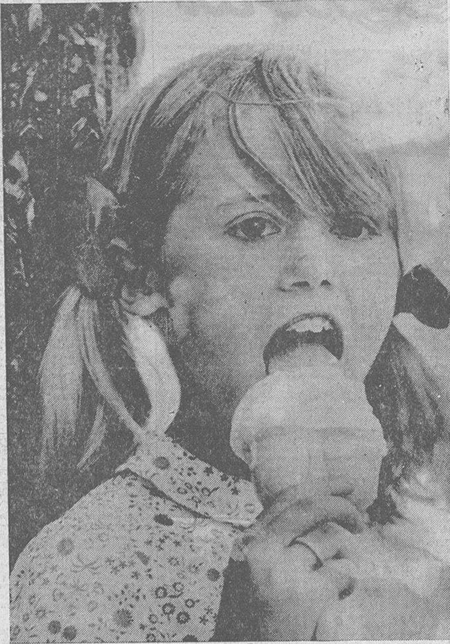
El signo externo del verano es el calor. Y el signo externo del calor es el refrigerio. El helado, en suma, sea fabricado en la nevera doméstica, en el frigorífico comercial o en el más humilde reducto de un carrito ambulante. Es éste, precisamente, el que más gusta a la niña. La mirada, ausente, perdida en sueños de juegos y aventuras. El paladar, en plena acción, gracias al ir y venir de la lengua sobre la alba superficie del mantecado. Aun queda el cucurrucho como propina selecta del festín. Inocencia de niña; inocencia de blanco; sinfonía estival que tiene al frío como protagonista insustituible, como contrapunto lógico a esas calendas que aprietan y nos traen la imagen del agua, del agua hecha helado para todos los gustos.