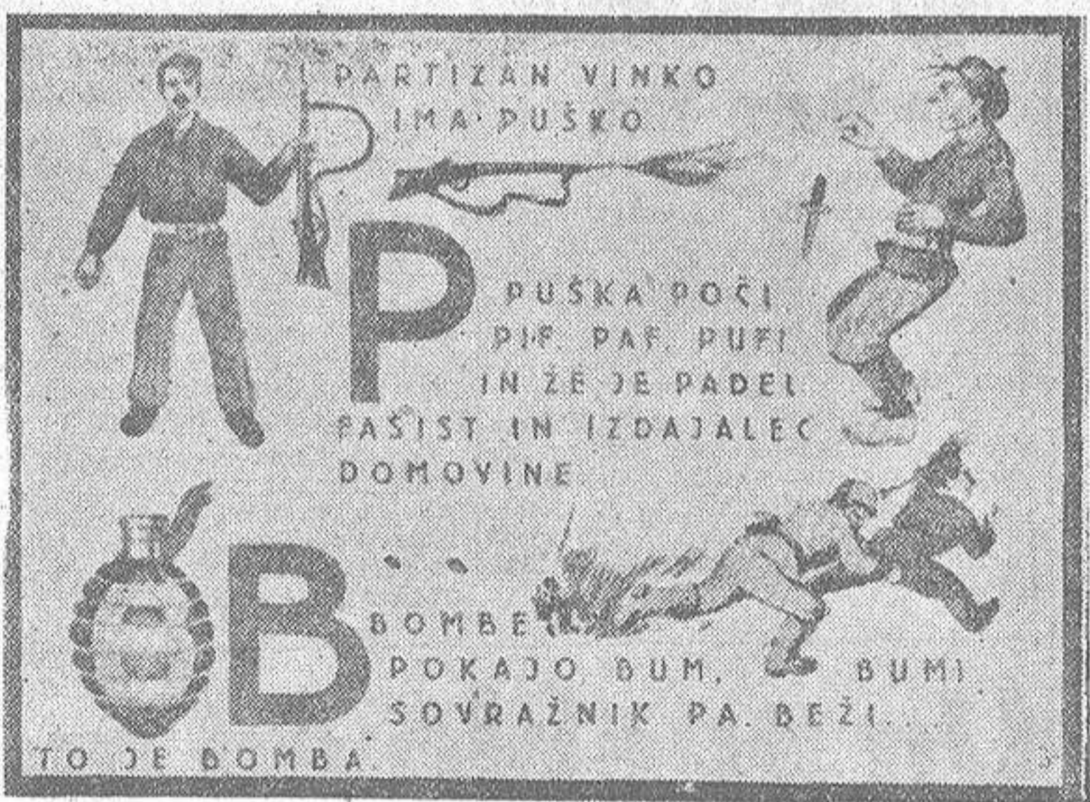
Página de uno de los libros de enseñanza primaria en Yugoslavia, en que se exalta el exterminio de los "reaccionarios", la vida de los guerrilleros, y habla de cómo emplear bien las armas

No, no busquéis, a lo largo de las novelas de este pueblo lírico que es Galicia, extraordinarios prototipos, creaciones trascendentes de personajes y de caracteres. Por nuestra novela, el protagonista es y seguirá siempre de la propia Galicia.