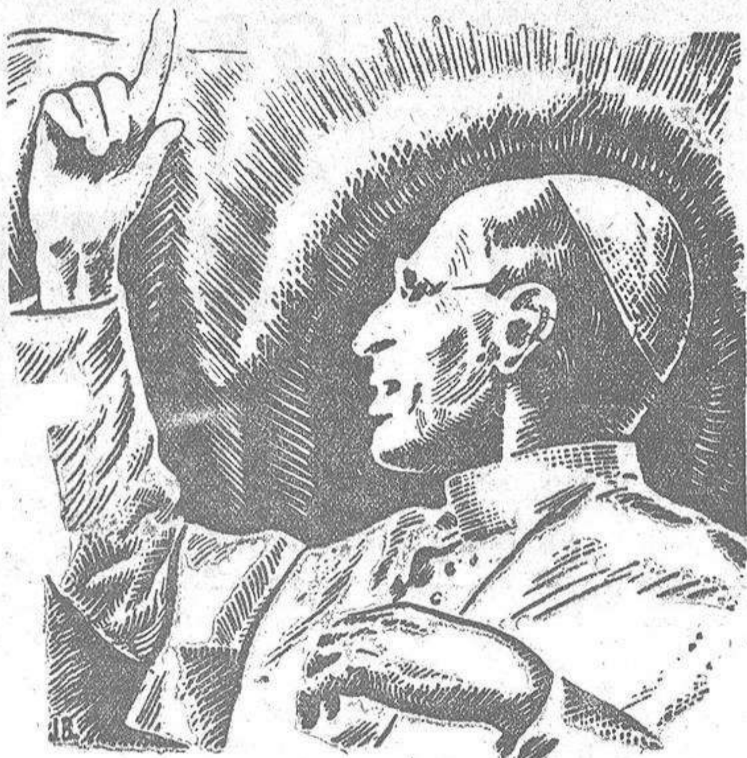
S. S. PIO XII

Mucho tienen que haber variado las cosas en el ámbito internacional para que el criterio rabiosamente hostil hacia nuestro país —mantenido únicamente en las esferas oficiales de ciertos países y en la propaganda pagada de un gran sector de prensa del extranjero— (CONTINUA EN CUARTA)