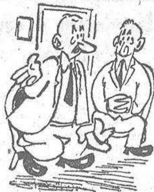
—He vendido el perro. —¿Y si entran ladrones por la noche en tu casa? —Ladraré yo.

VIGO, 7.—El entrenador del equipo Puebla, de Méjico, que viaja en el trasatlántico español "Megallanes" y que ha zarpado a las nueve de la noche rumbo a América, ha manifestado que confía en que a finales de la temporada próxima habrá un intercambio entre los futbolistas españoles y mejicanos, y que el futbol mejicano progresa cada año más.—(ALFIL)