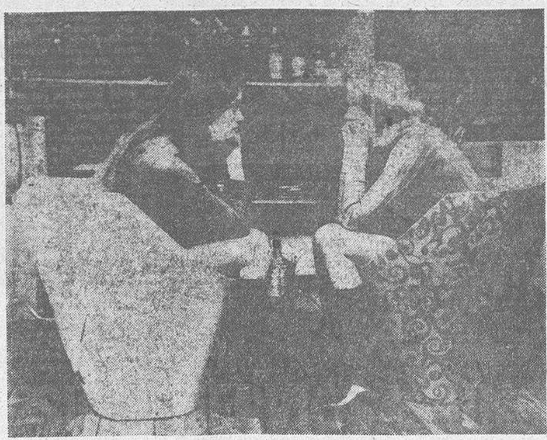
Deprimidas, con las manos sobre la cara, esta tristeza y depresión —que a veces conduce a la bebida— es una situación muy extendida en las gentes de nuestro tiempo, incluso de la juventud. — (Foto EFE).

cita, le recomendaban un cambio de aires y, acaso, ver durante horas cómo corría el agua por los arroyos. La medicina no tenía el campo tan abierto como ahora, y desde luego, no estaba estancada. Muchas gentes no iban al médico sino cuando ya se encontraban muy seriamente enfermas, cuando el médico (del que habían dicho siempre que no servía para nada) apenas si podía hacer algo para aliviar al paciente perseguido. Era la tragedia del médico, al que sólo le llevaban moribundos y que no dispo-