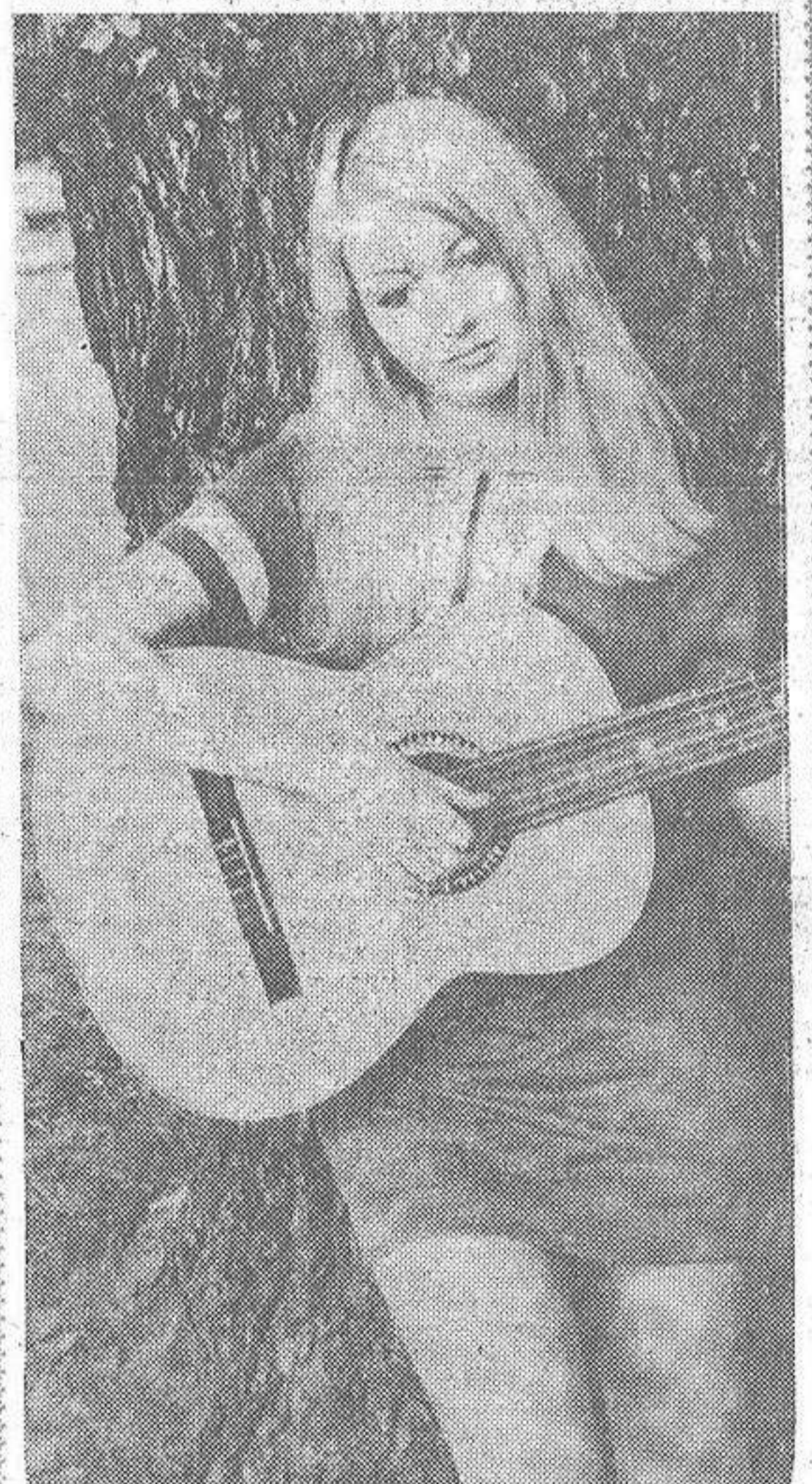
Como verdadera sorpresa en el mundo del espectáculo se considera la próxima incorporación al conjunto de los "Beatles" de esta jovencita de diecinueve años. Se trata de Mary Hopkin, que ha sido requerida por Paul McCartney para que actúe con el conjunto de música ligera más famoso del mundo. Mary ha deslumbrado al famoso intérprete, que le ha propuesto que cantara una canción con él y unirse al grupo a partir del próximo septiembre. El título de la tonada es "El buen tiempo viejo" y con ella estima Paul que los "Beatles" obtendrán un gran éxito