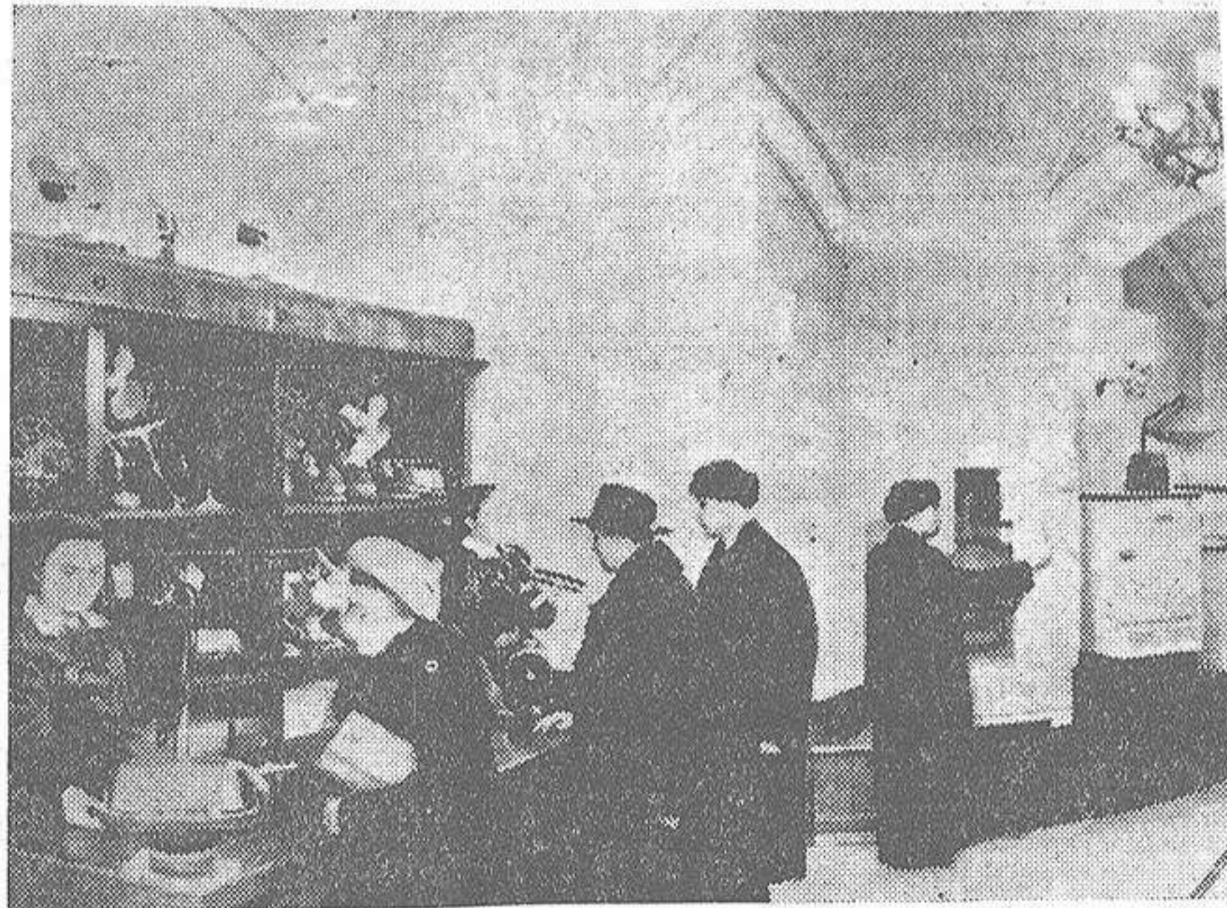
Lujoso aspecto de una tienda de electrodomésticos en Moscú. Los precios de televisores, radios, lavadoras, etc., son tan elevados, que los moscovitas acuden a las casas de empeño, una herencia burguesa que en Moscú se respeta. ¿Por qué? (Foto Cifra).

Un regalo de estilo en Estilo OBJETOS PARA REGALO