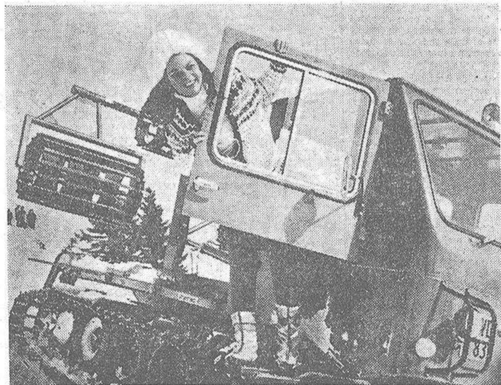
Superada su aventura sentimental con el actor Maurizio Arena, Beatriz de Saboya vuelve a ser feliz. Del viaje a los Estados Unidos regresó completamente curada de su fracaso amoroso, que, en un principio, pareció verdadera pasión y que, a la postre, se tradujo en una serie de recriminaciones mutuas entre los que se reputaban como grandes enamorados.