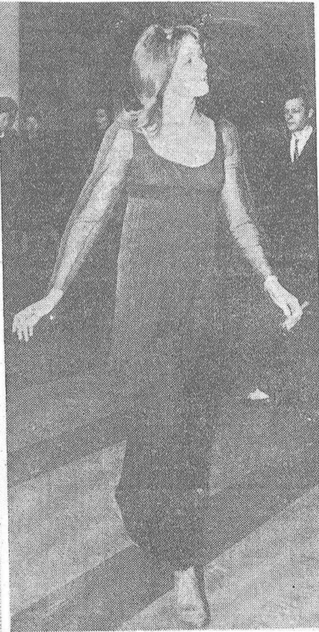
He aquí a la actriz inglesa Vanessa Redgrave, que hace pocos días causó sensación al aparecer tocada con el luto vietnamita. En seguida tuvo noticia de que había sido incluida en la "lista negra" establecida por algunos productores americanos.