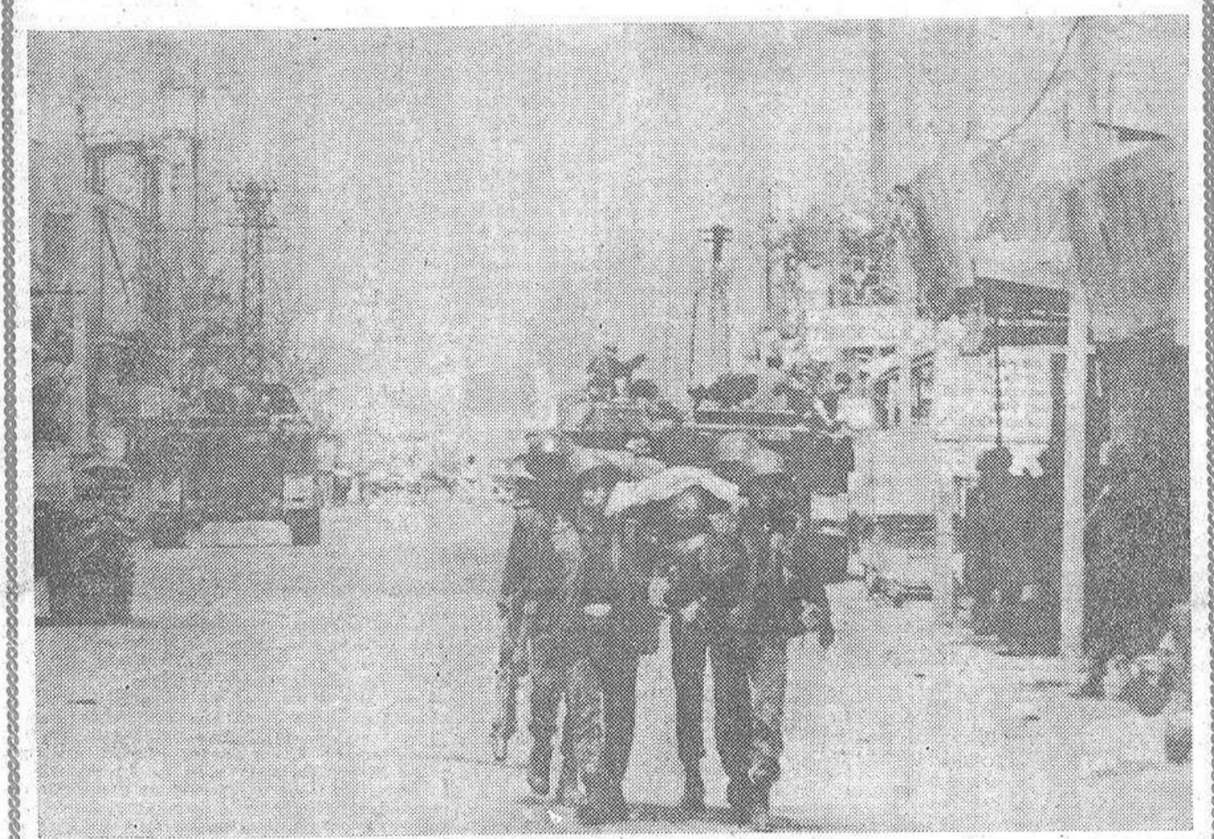
La lucha en el Vietnam adquiere cada vez mayor intensidad. La reciente ofensiva del Vietcong contra alguna de las principales ciudades del país ha puesto en situación apurada a las fuerzas americanas. Aun cuando los ataques parecen haber disminuido, se habla de una segunda ofensiva comunista contra las fuerzas aliadas. Se explican, pues, escenas como las que recoge la foto, en la que aparecen tanques y soldados durante uno de los combates registrados en las calles de Saigón