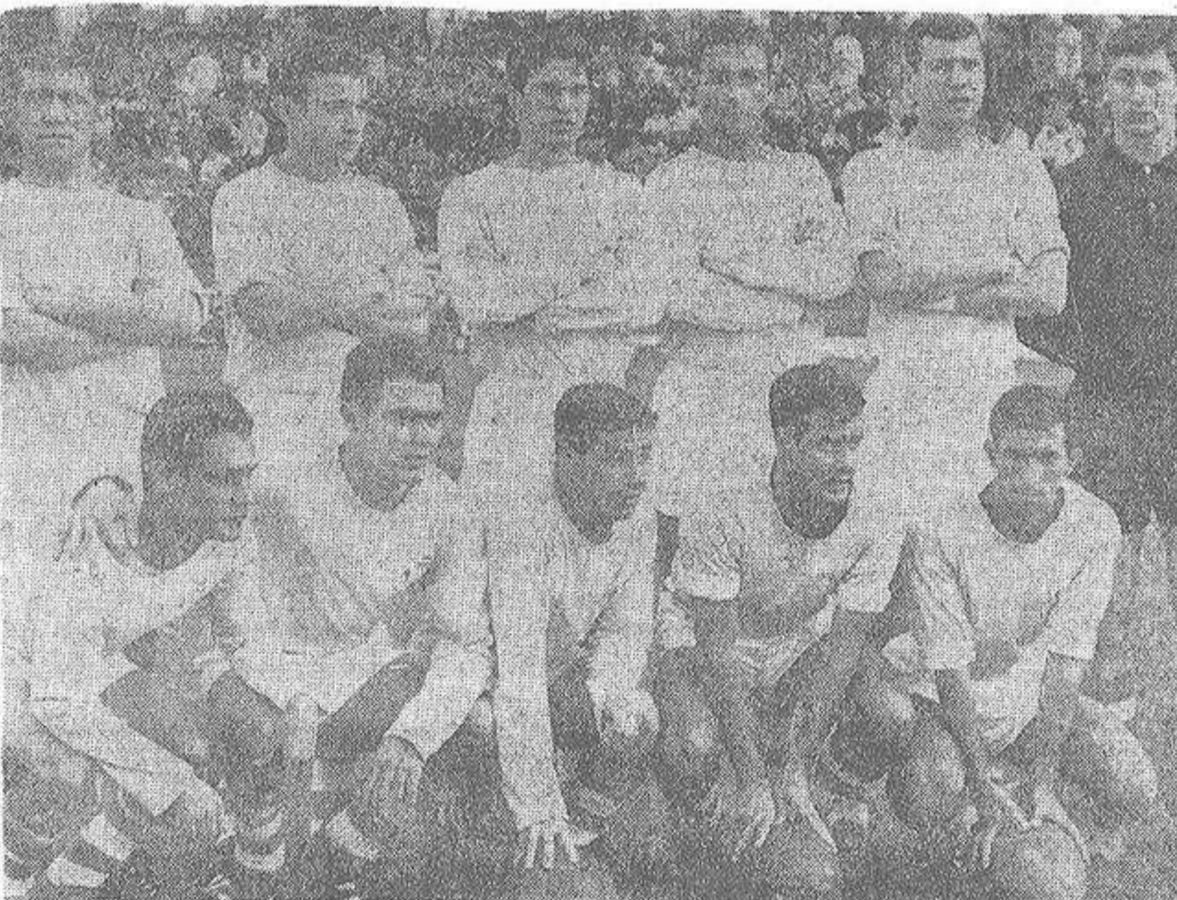
Los equipos del Deportivo y del Celta, que ayer jugaron en Balaídos el encuentro de la máxima rivalidad regional.