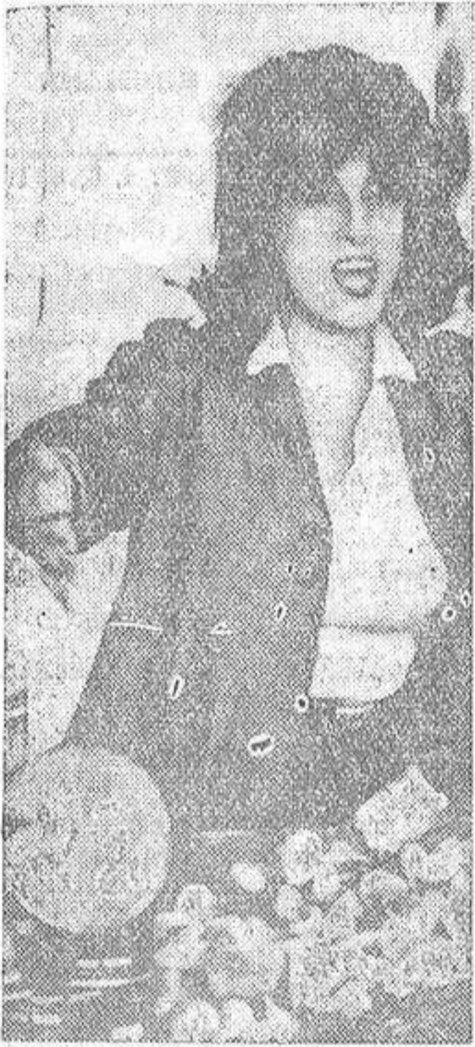
He aquí a la extraordinaria actriz Anna Magnani en una escena de su última película, «Mamma Roma» que, bajo la dirección de Pasolini, se rueda en Italia. La Magnani desempeña en esta cinta el papel de una mujer del pueblo que, después de haber «vivido su vida», trata de preservar a sus hijos de los reveses de la fortuna; pero cuantas iniciativas toma en este sentido, acaban por malograrse. Como compañero de reparto de Anna figura Ettore Garofalo, joven actor descubierto por Pasolini.