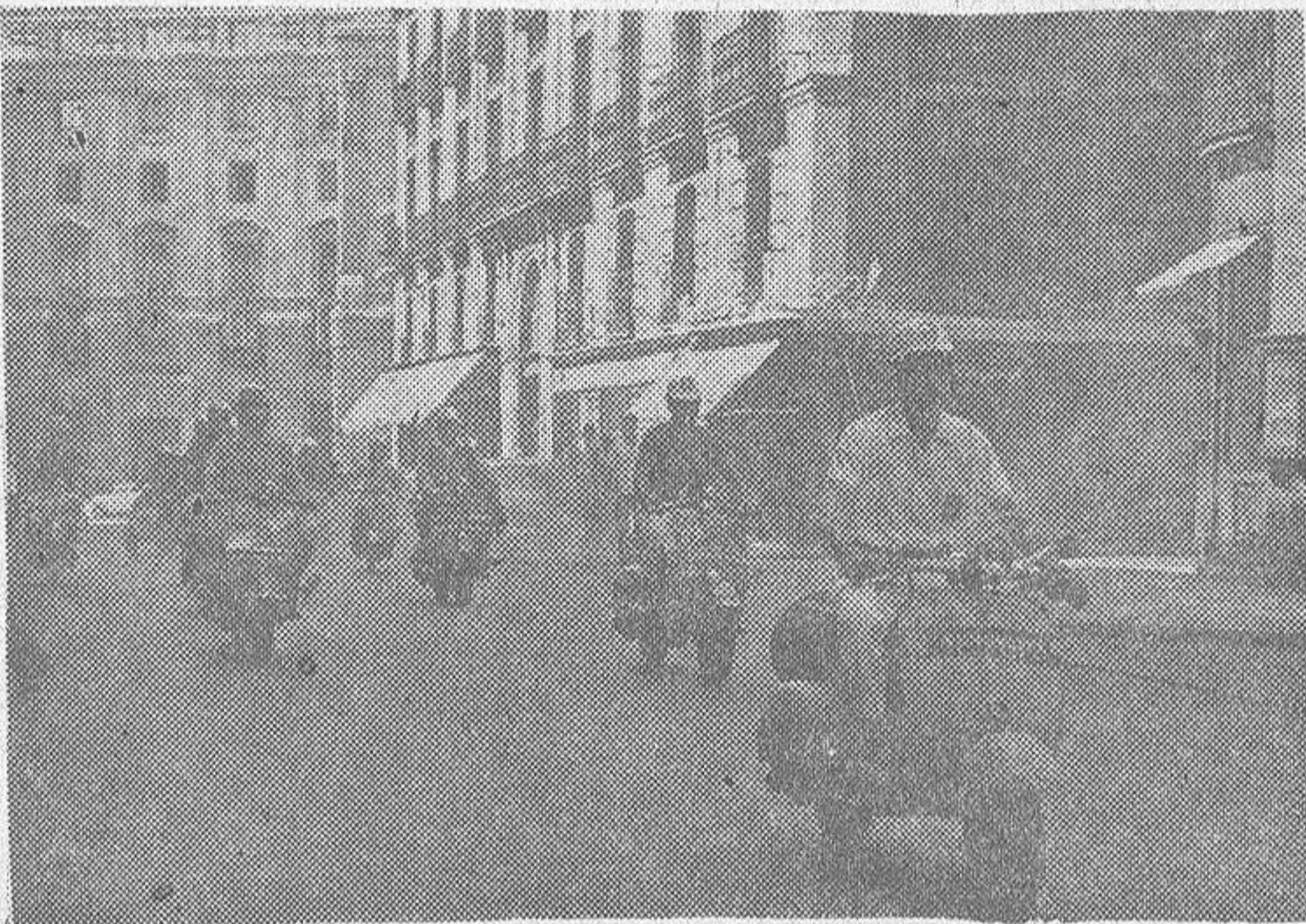
Un detalle del paso de los "vespistas"

Con la entrega de los trofeos a los grupos e individuos más destacados y la de los premios sorteados entre los participantes del Eurovespa, concluyó esta reunión de los vespistas continentales. El Vespa Club de Europa, expresó su su próximo congreso anual, cuál será el punto de cita para el año próximo. Allí volverá a florecer la cordialidad de siempre.