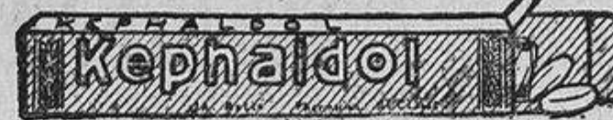
Pastilla de un tubo de KEPHALDOL

El tubo pequeño de seis pastillas. . . . . Ptas. 1,15 (Por correo franquizado, 30 céntimos más.)