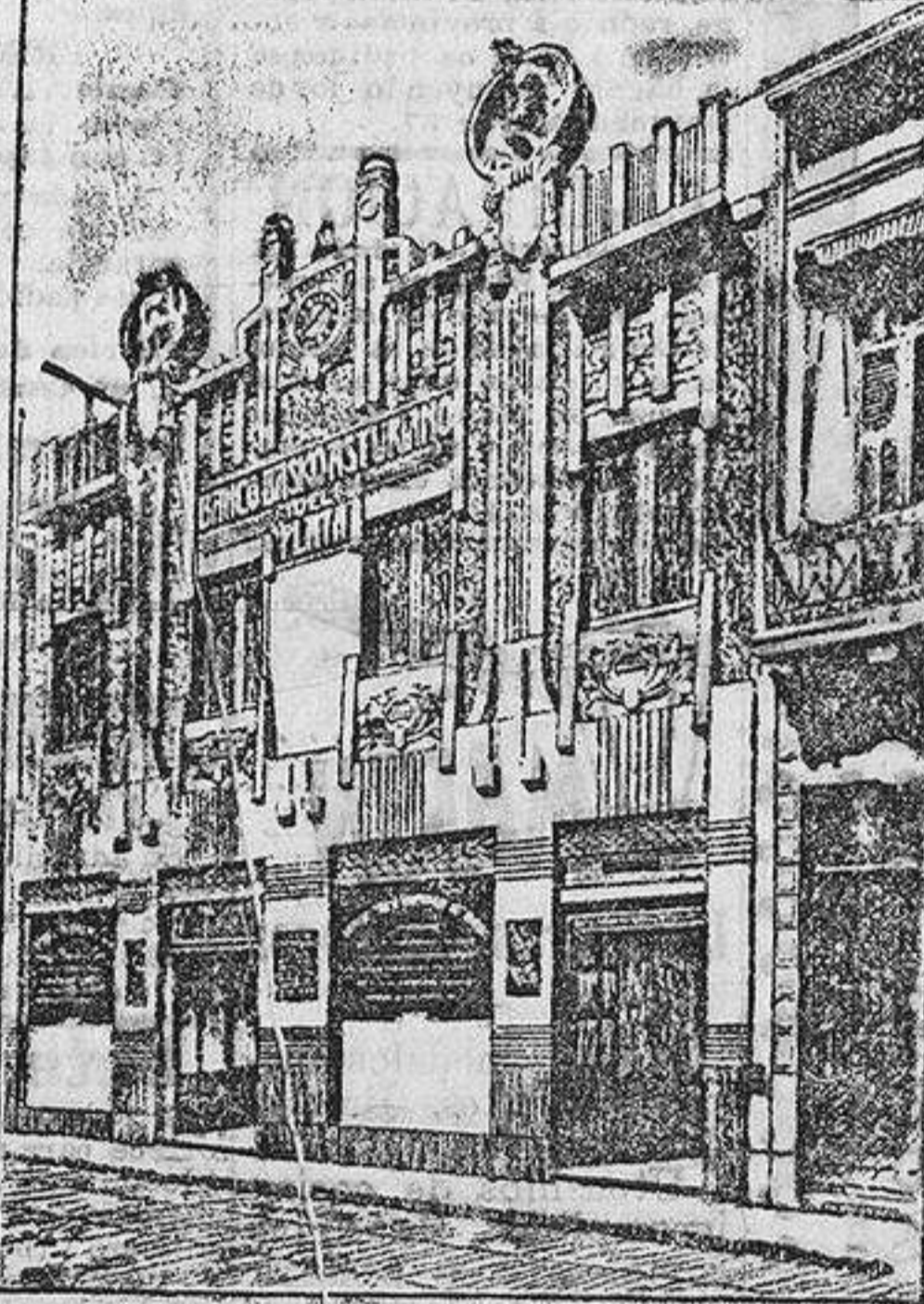
EDIFICIO DEL BANCO

Los grandes Mercados del Plata consumen anualmente del Extranjero productos por valor de 500 millones de pesos oro, y de España sólo 14.