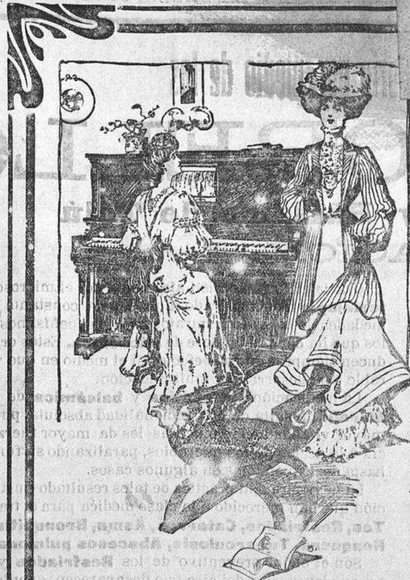
No se puede dejar de admirar escuchando las ejecuciones admirables de la Pianola Metrosillo...

REAL.-No hay función. ESPA. OL.-9. (Presente...)