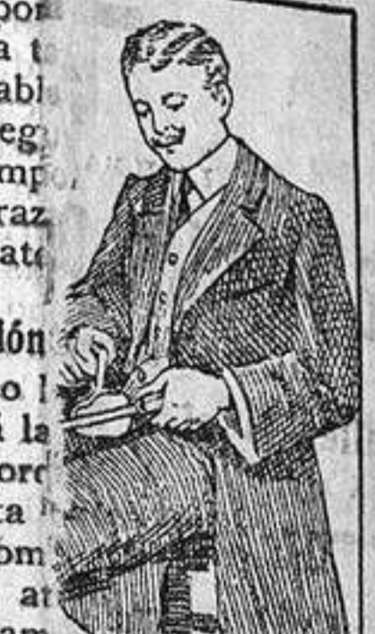
desaparece en p... dos con el uso del VEDEE

que necesitan nutritivos con (rts, etc.)