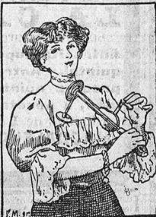
Después de un breve tratamiento con el «VEEDEE» se respira libremente.