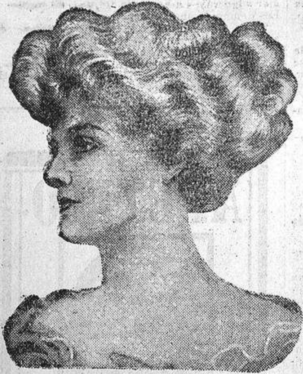
Un peinado de moda.

ELIXIR SALAMO alivia a las primeras tomas y cura NEURASTENIA Y ANEMIA Es el mejor tónico reconstituyente. Venta en farmacias. Depósito, PEREZ, MARTIN VELASCO.