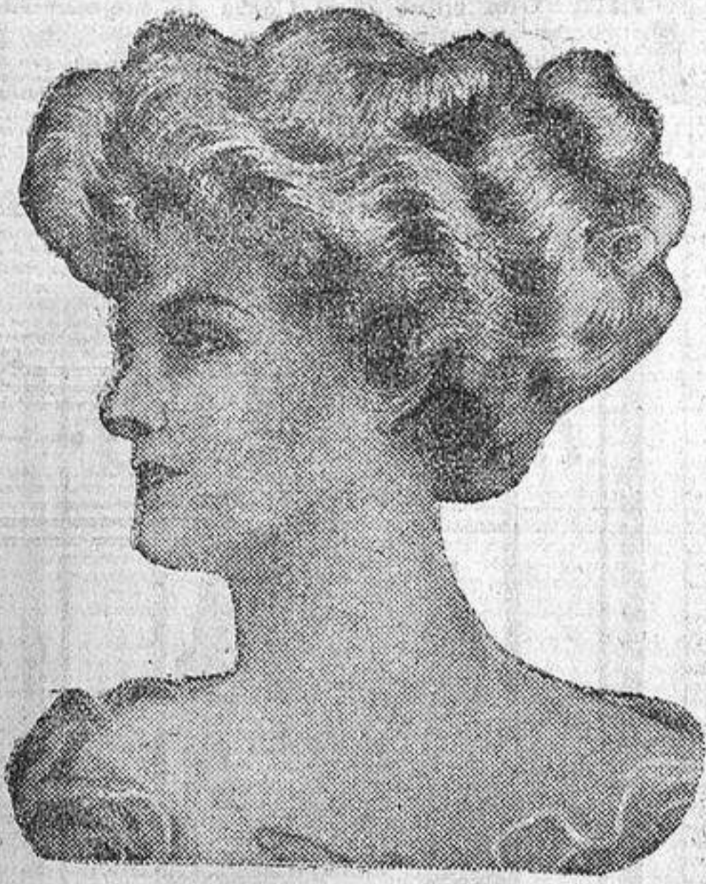
Un peinado de moda.

ELIXIR SALAMO alivia a las primeras tomas y cura NEURASTENIA Y ANEMIA. Es el mejor tónico reconstituyente. Venta en farmacias. Depósito, PEREZ, MARTIN VELASCO.