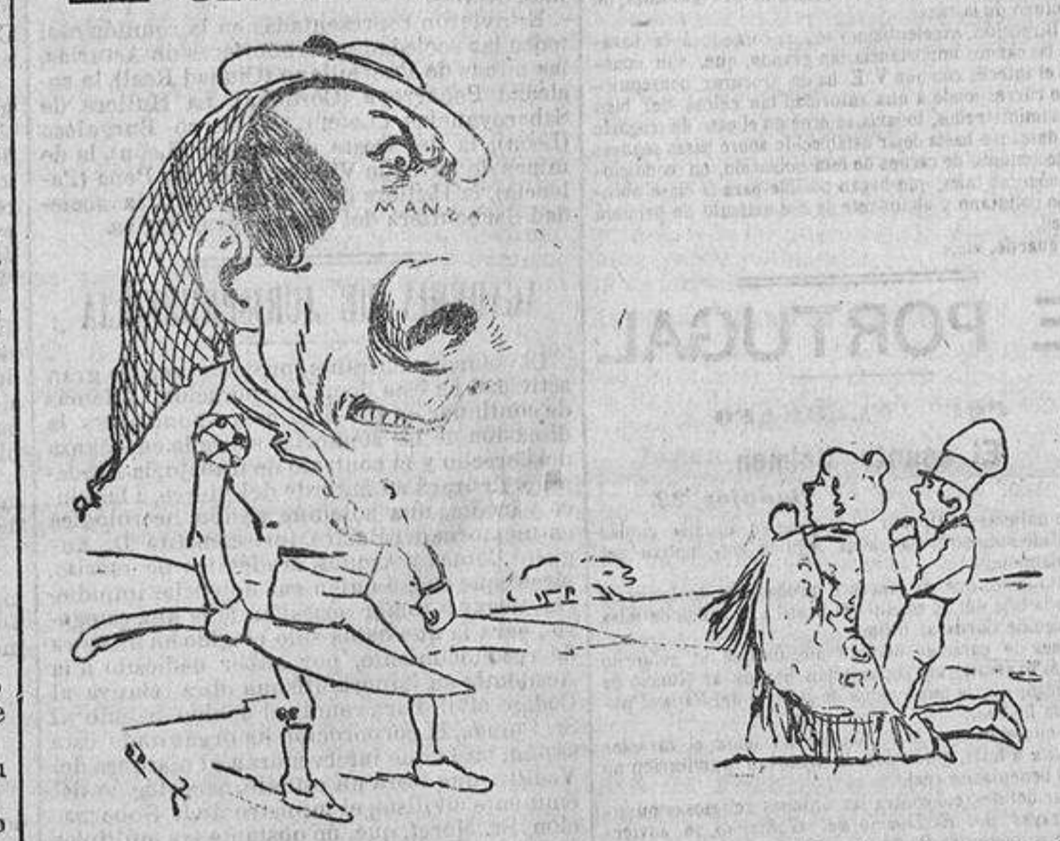
—¡Os advierto que aunque me toméis tantas veces el pelo, á mi también se me hinchan las narices!..