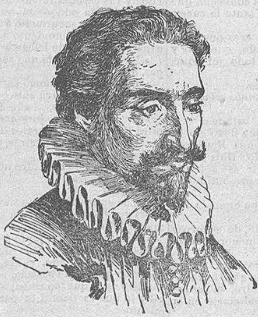
De un grabado de B. Maura