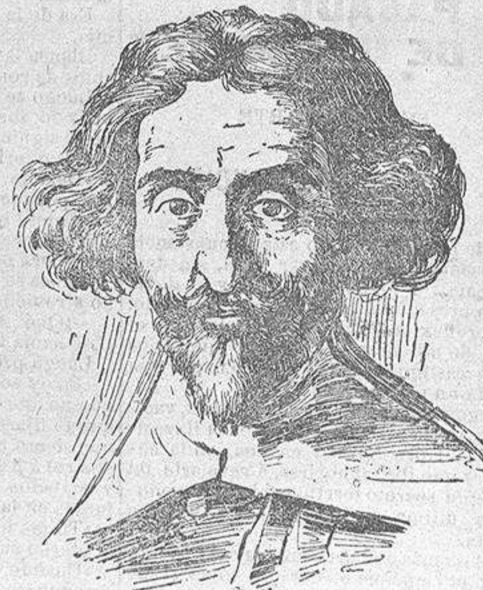
El atribuido á Velázquez