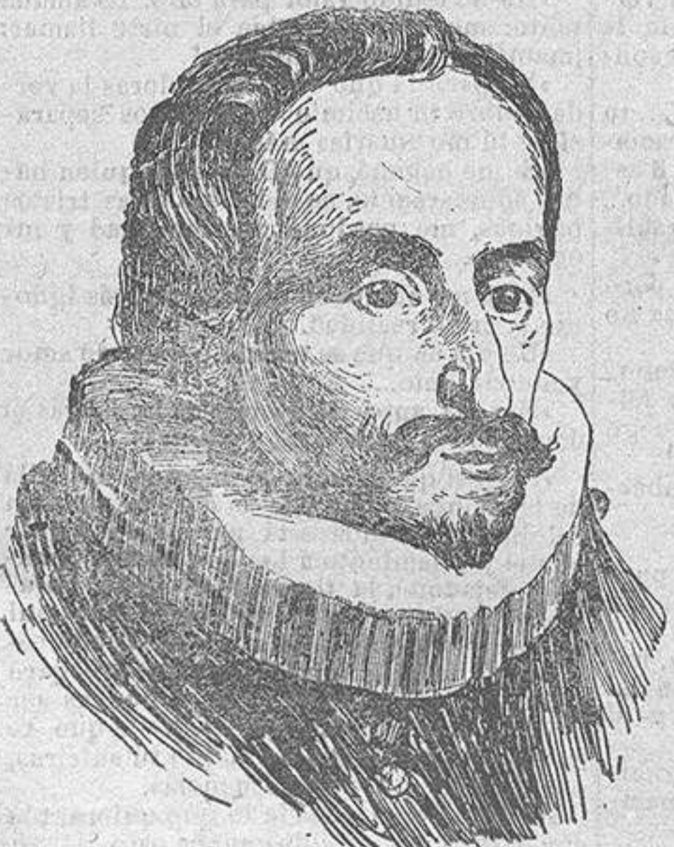
El de Jauregui que se conserva en la Academia de Bellas Artes de San Fernando