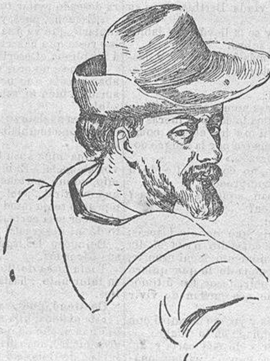
De un cuadro de Francisco Pacheco