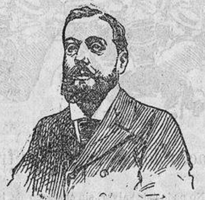
Don Julio Burell.

La prensa tuvo anoche unánimes elogios para los nombramientos de los nuevos directores generales de Agricultura y Obras públicas, D. Julio Burell y conde de San Luis, cuyos merecimientos son tan notorios como sus aptitudes para ejercer tan importantes cargos en las circunstancias presentes.