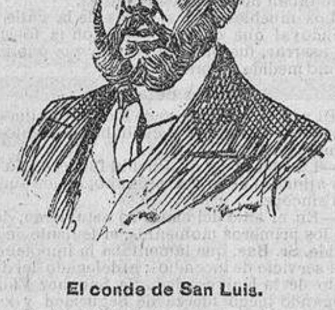
El conde de San Luis.

Hombres de cultura probada, de ideas propias, su campaña mejor estará en recoger que los asuntos de Obras públicas y Agricultura dejen de ser tramitados y resueltos monótona y rutinariamente. Las acometividades y energías de arriba deberán llegar a todas partes, para impedir suceda una vez más que fracasasen ante las pasividades de abajo.