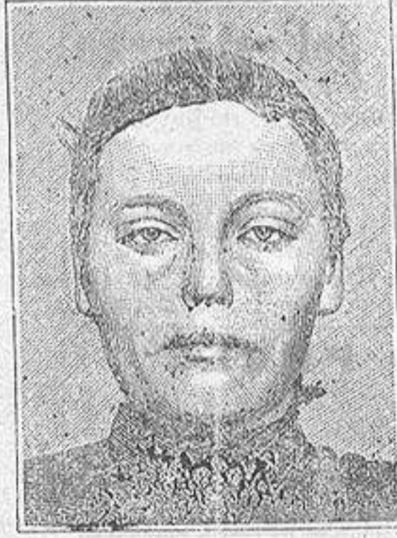
Antes de la curación Después de 15 días de tratamiento