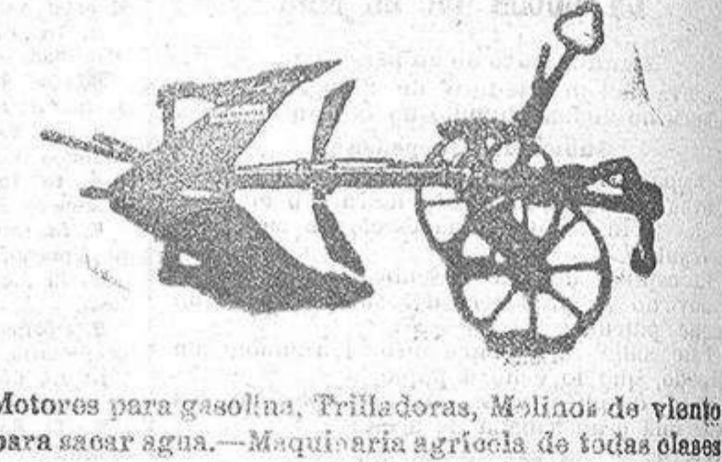
Motors para gasolina, Trilladoras, Molinos de viento para saacar agua.—Maquinaria agrícola de todas clases

Arados «Brabant Regional», ancha forjada ó fundada de cuatro tamaños y arados de otras muchas clases.