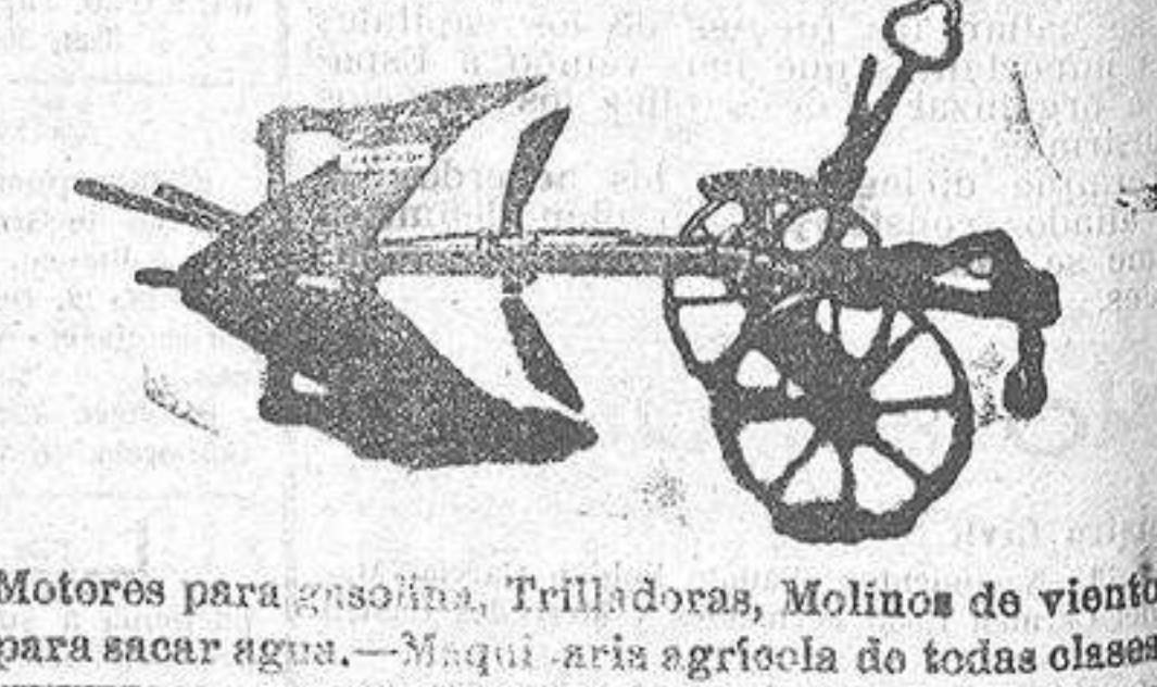
Motors para gasolina, Trilladoras, Molinos de viento para sacar agua.—Maqui aris agrícola de todas clases

CANTÓN GRANDE, NÚM. 8.—CORUÑA. Exposición y venta de muebles de todas clases. Ferrería, Quincalla, Aceros, Cristales, Bombas para pozos, Corderería, Herramientas. Al por mayor, Real, núm. 14.—Al por menor, Real, 77 Bazar del Siglo XIX. Artículos de casa y sport; perfumería, etc. Pinturas superiores PARA Molinos harineros LA FORTÉ Y BORDOGNE Hay cientos de pares funcionando vendidos por esta casa. Arados «Brahaut Regional», ancla forjada ó fundada de cuatro brazos y arados de otras muchas clases.