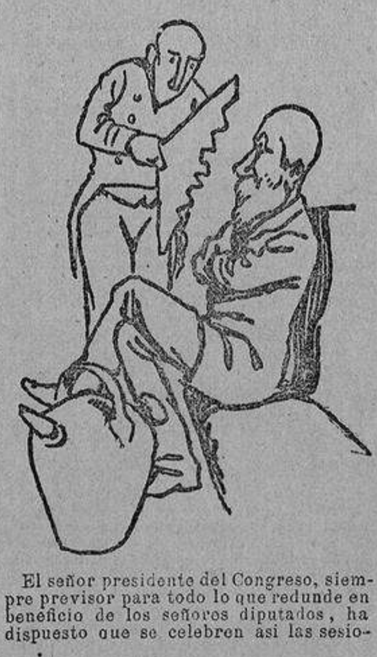
El señor presidente del Congreso, siempre previsor para todo lo que redunde en beneficio de los señores diputados, ha dispuesto que se celebren así las sesiones.

hemorragia tan intensa que vino a caer casi exánime, no lejos del médico.