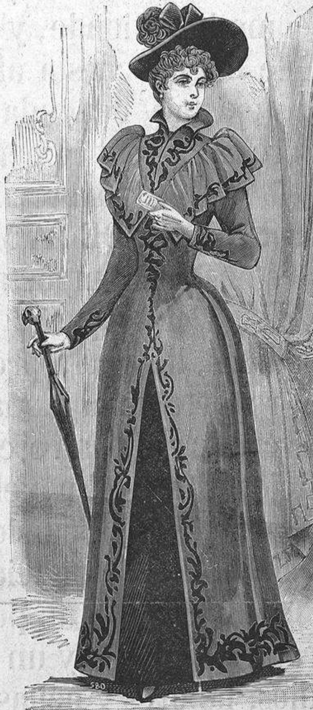
NUM. 12.—Redingote elegante.