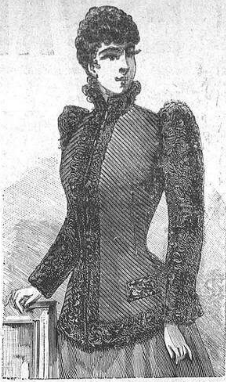
NUM. 4.—Chaqueta a en rafo diagonal.