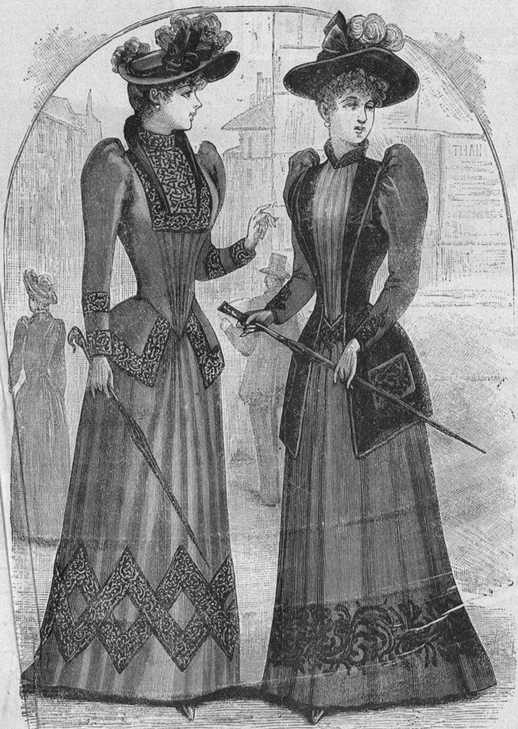
Núm. 11.—Dos trajes de abrigo.

un mechón hácia detrás para colocarlo como tirabuzón, el cual puede ponerse postizo si el pelo natural es poco. Toda la parte de detrás se esconderá formando rodete retorcido bajo la masa de cabellos delanteros y de debajo de la oreja que se peinan hácia arriba de modo que rodean y tapan completamente al rodete de pelo natural; la sujeción de estos cabellos puede hacerse por medio de orquillas largas, pero finas y suaves, que se cubren con un manajo de flores azules y blancas, el cual se desenvuelve en guirnalda; cayendo hácia atrás, entre los rizos delanteros que son muy altos y abundantes, se coloca una bonita peineta de metal con grandes agujeros.