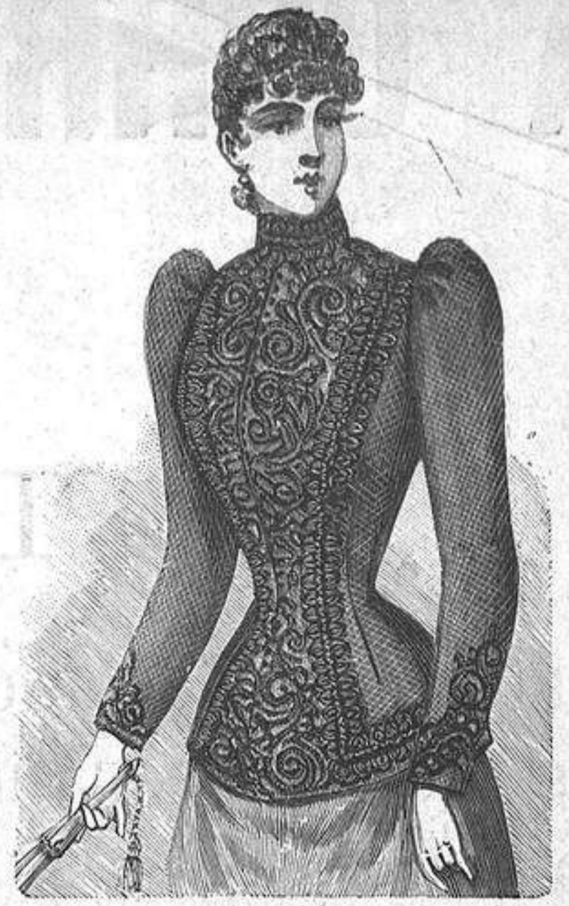
NUM. 5.—Chaqueta ajustada.