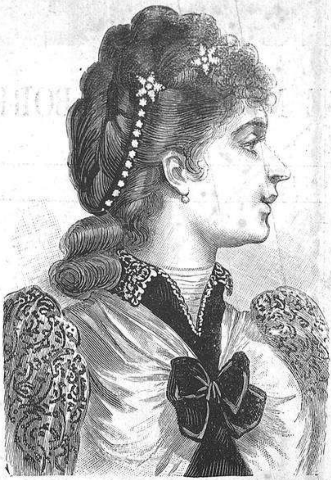
NUM. 7.—Diseño para reunion.

Como la época de los grandes frios está ya en su apogeo, creemos deber decir á nuestras lectoras algunas palabras sobre los grandes abrigos tan necesarios en este tiempo. La forma usual del redingote es de mucha comodidad y abrigo; pero como la moda se muestra incansable respecto á variaciones, de aquí que las grandes casas de confecciones de París nos presenten este año un nuevo modelo de redingote, que consiste en una enorme capa que cubre enteramente todo el traje y en el centro de la espalda forma un grupo de pliegues artísticamente colocados, de manera que los