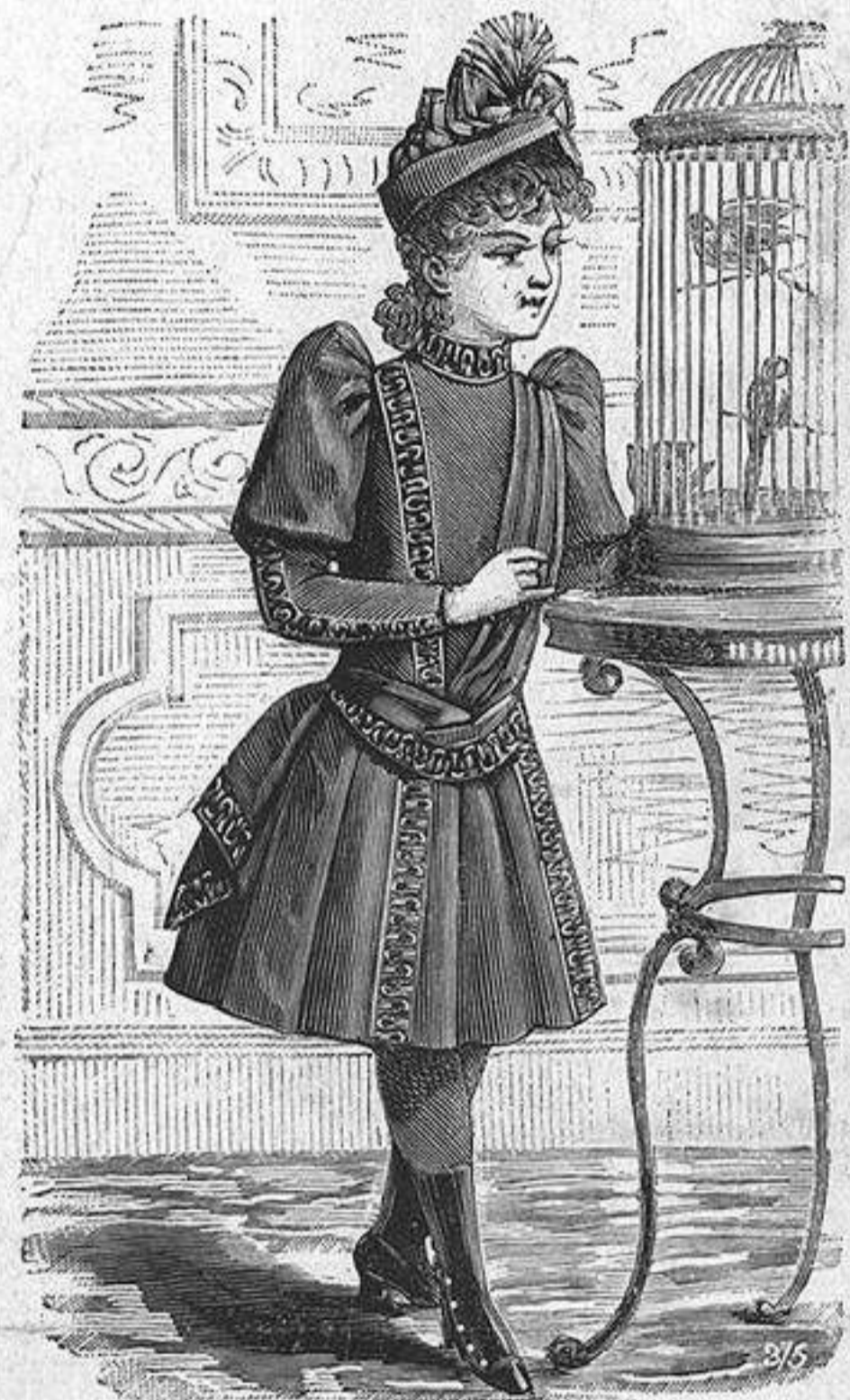
NUM. 6.—Traje para niña.