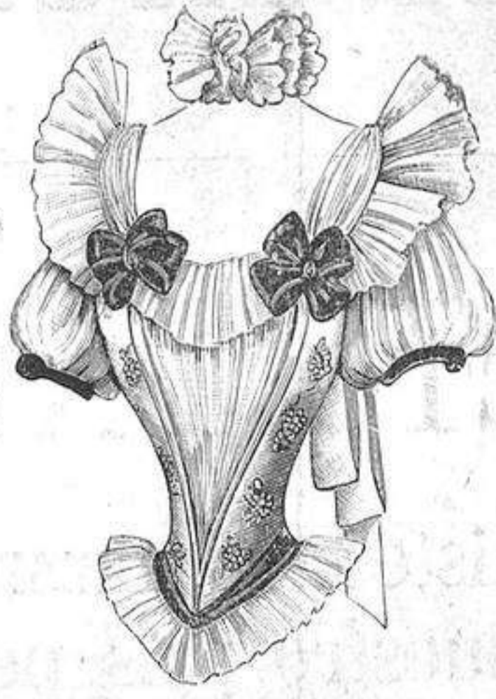
NUM. 3.—Cuerpo de baile.