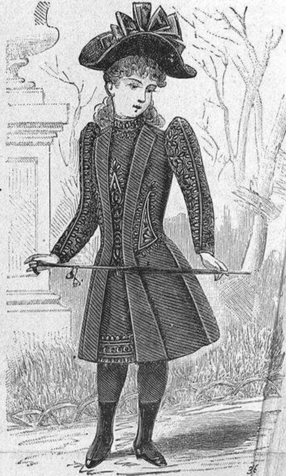
NUM. 9.—Traje para niña.

primeros pliegues dán á la capa el vuelo y frunce de un faldon y los segundos figuran un par de paniers posteriores, puesto que sobre el faldon van; pero todo debe saber hacerse con solo las dos piezas que forman el redingote, yendo la costura de estas dos piezas en el centro de la espalda.