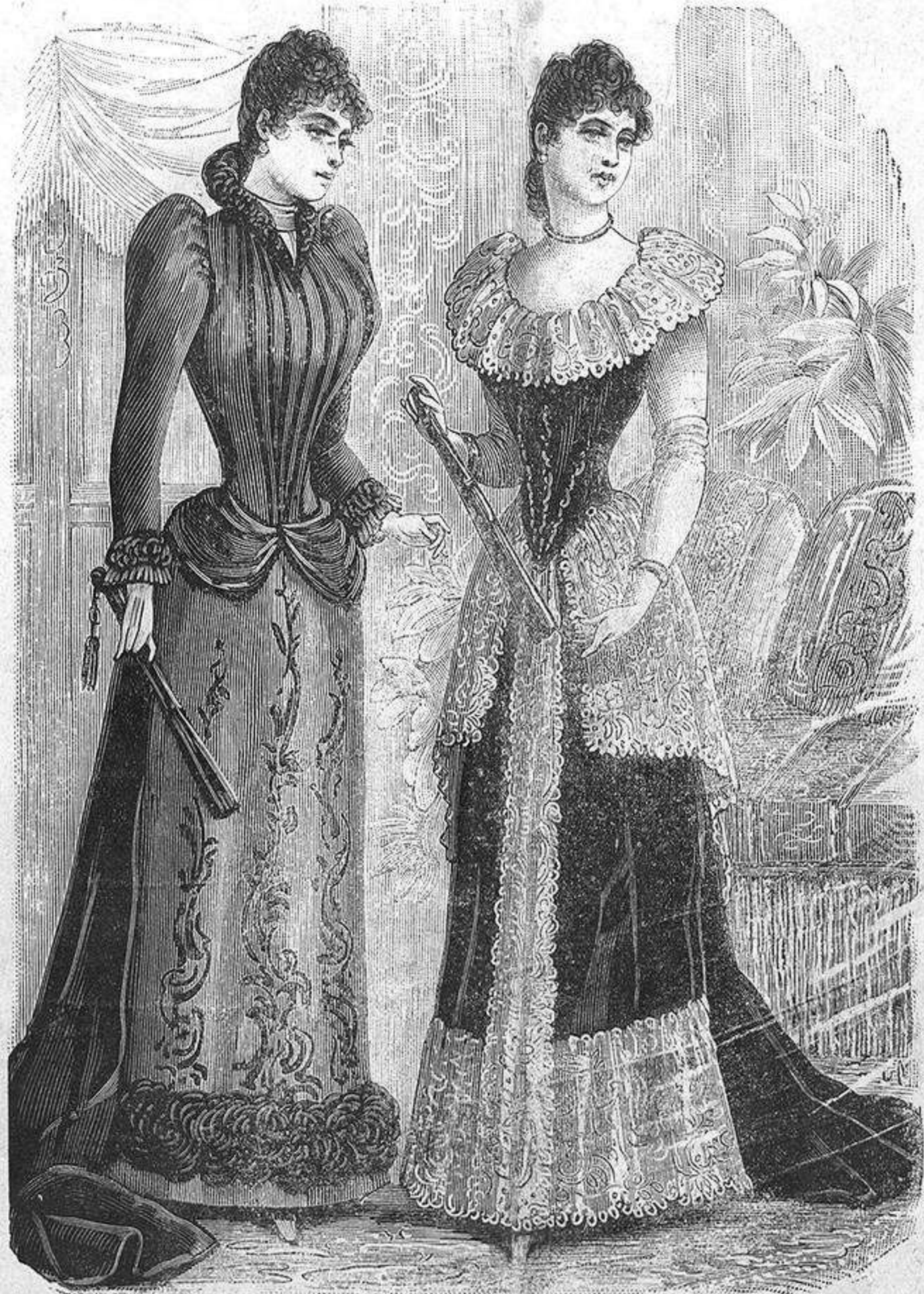
Núm. 1.—Los trajes: uno de banquete y otro de baile.

Núm. 8.—Peinado de reunión. Los cabellos de delante de la nuca se ondean todos con tenacillas de fuego. Si los cabellos son abundantes hay que reservar