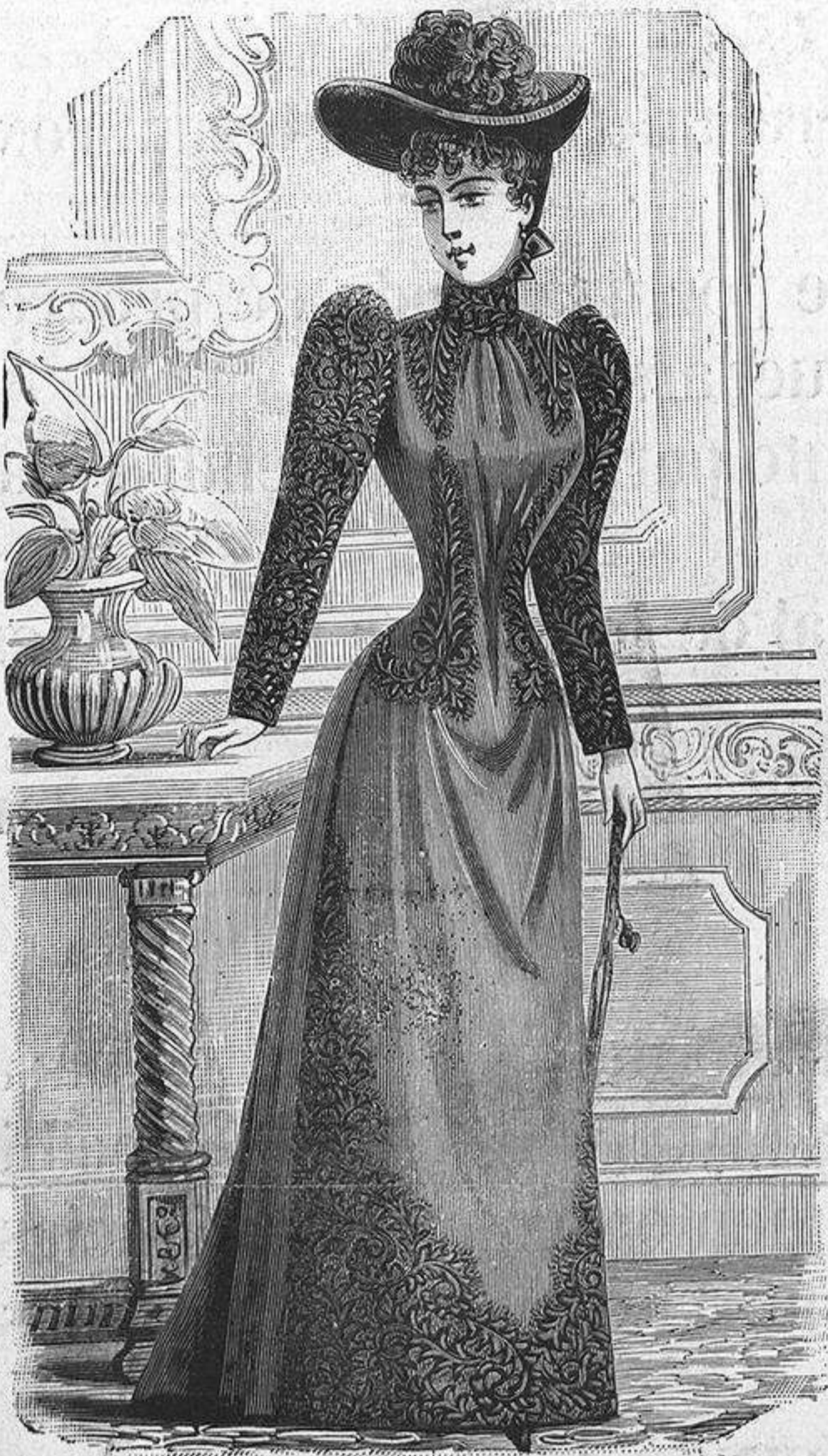
NUM. 10.—Traje de paseo.