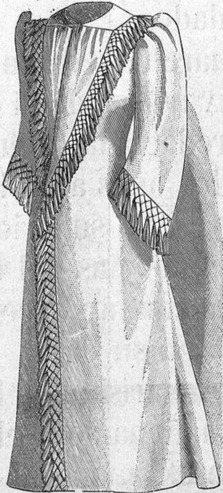
NUM. 2.—Bata de mañana.