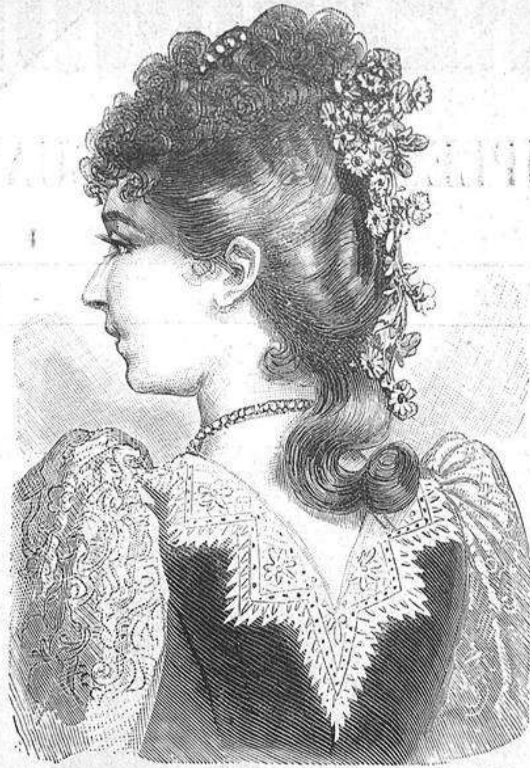
NUM. 8.—Peinado para reunion.