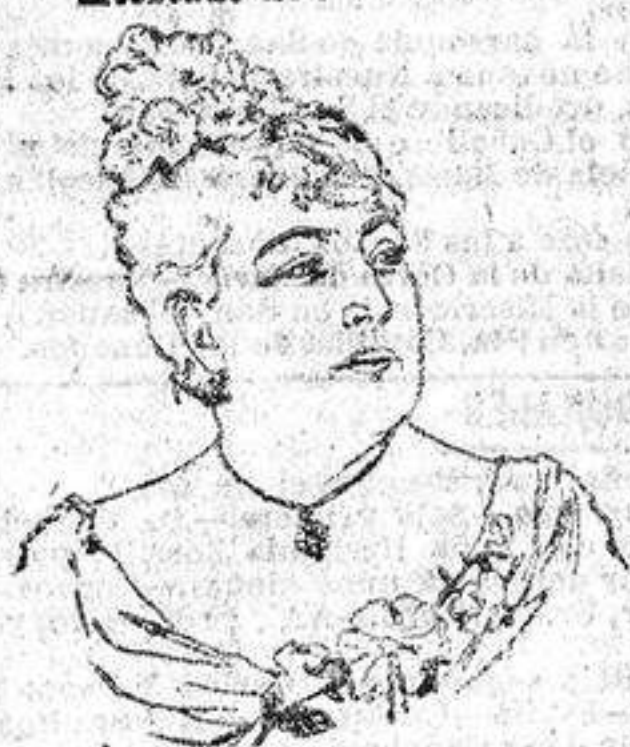
Atestado de M me Thérèse

Desde el momento que uso sus Pastillas Géraudel he hallado un perfecto estado de salud. Me constipaba há mucho tiempo y tambien me sentia muy débil. Los efectos benéficos de su preparado, me ha permitido volver á mi estado normal de salud. Me ha permitido volver á mi estado normal de salud. Me ha permitido volver á mi estado normal de salud.