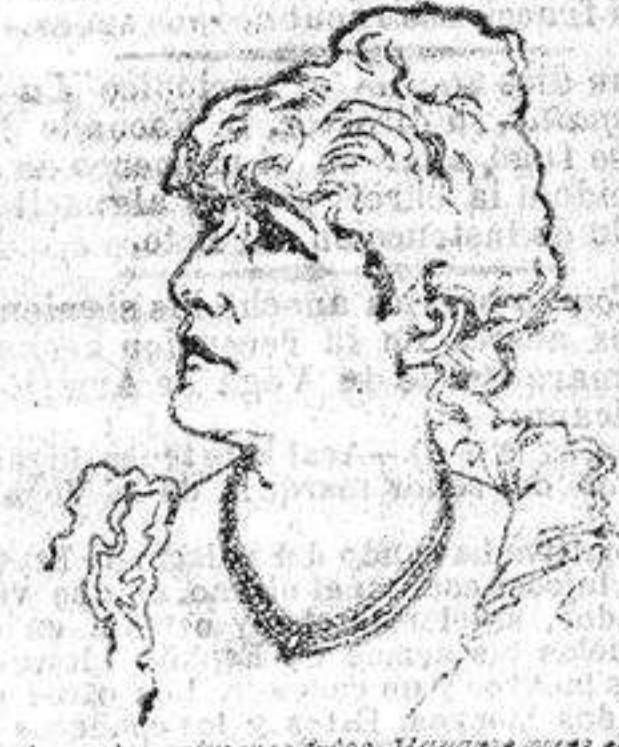
Atestado de M me Sarah Bernhardt

Me ha permitido volver á mi estado normal de salud. Me ha permitido volver á mi estado normal de salud. Me ha permitido volver á mi estado normal de salud.