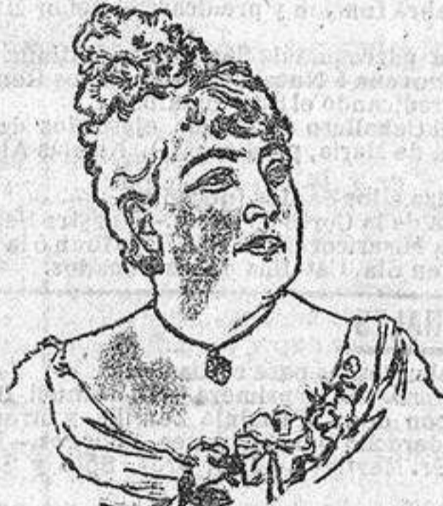
Atestado de M me Thérèse

Desde el momento que uso sus Pastillas Géraudel me hallo en perfecto estado de salud. Me constipado ha desaparecido totalmente y tambien resiente mi voz los efectos benéficos de su preparado. En el porvenir podré cantar los méritos de las Pastillas Géraudel y eso con voz tanto mas fuerte que á la de la naturaleza aliviaré la voz del aprado.