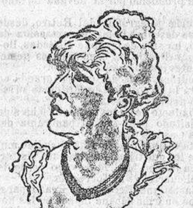
Atestado de M me Sarah Bernhardt

Ya vienen los primeros frios. Rogame pues el favor de enviarme una nueva provision de Pastillas Géraudel. Cumplimientos.