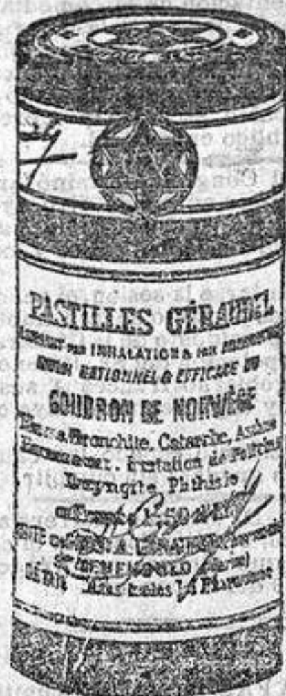
Medalla del Estado de las Verdaderas Pastillas Géraudel