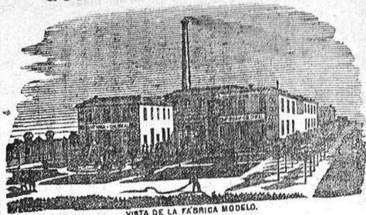
VISTA DE LA FÁBRICA MODELO.