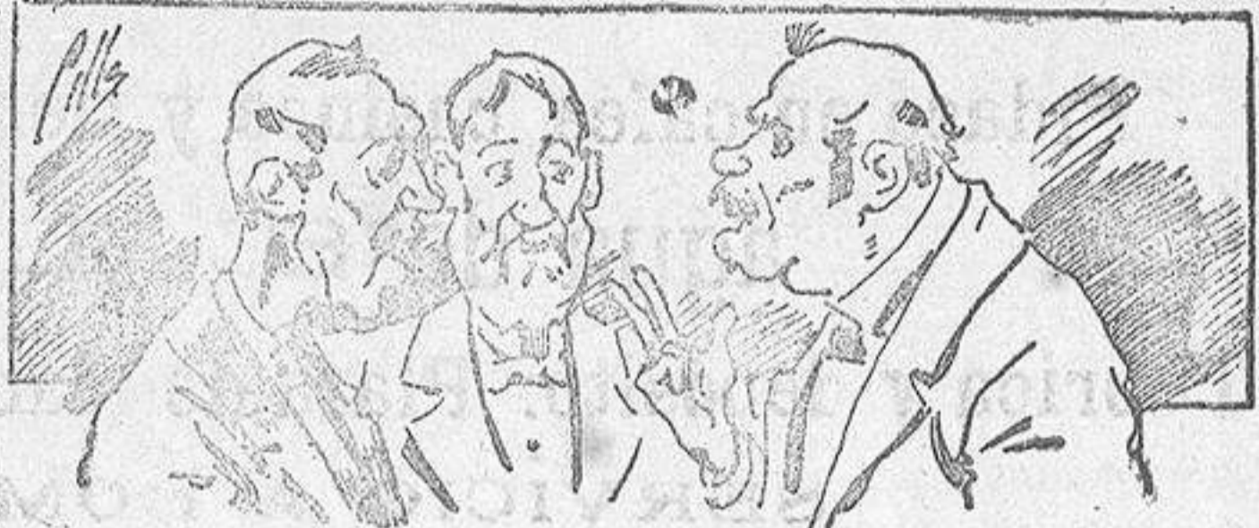
Abominan á nuestros libros..... pero los compran.

fórmulas para toda clase de industria, y cuantas noticias y conocimientos puedan ser beneficiosos. Cuenta además con buenos grabados, parte literaria excelente; da regalos mensuales á sus lectores con la Lotería Nacional y participaciones en la misma, á cuyo efecto compra todos los sorteos, y en una de las Administraciones más afortunadas por la suerte, billetes enteros. La suscripción y los números que se nos pidan se sirven gratuitamente á correo vuelto y franqueados, con sólo indicar el nombre y dirección del que lo desea en sobre dirigido al Sr. Administrador de