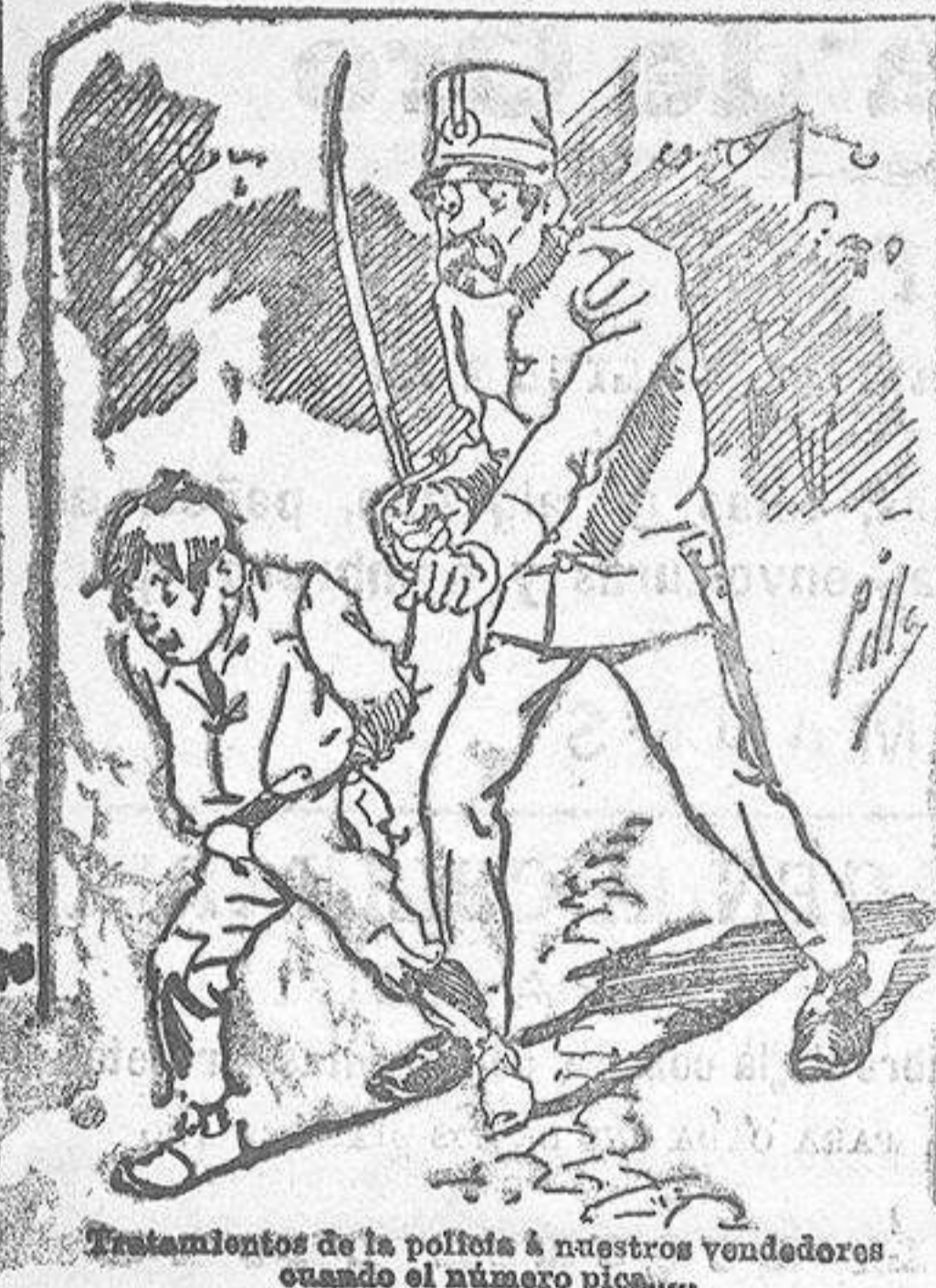
Tratamientos de la polifolia á nuestros vendedores cuando el número pica....