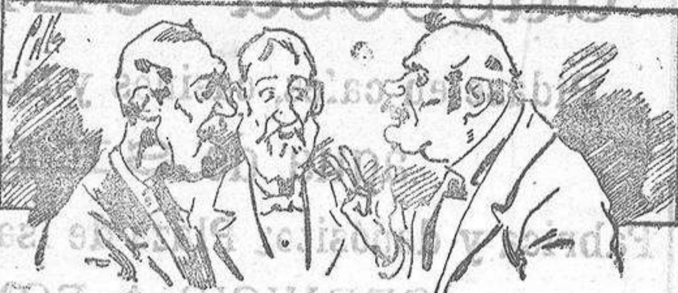
Abominan á nuestros libros..... pero los compran.

Todas las personas de gusto, curiosas e ilustradas deben pedir al Director de LA AVISPA, apartado núm. 8, MADRID, un ejemplar que se remite gratis y franqueado. Esta Revista Enciclopédica Popular publica recreaciones científicas, recetas de cocina, repostería, confitería, vinos, licores, pinturas, barnices, betunes y fórmulas para toda clase de industria, y cuantas noticias y conocimientos puedan ser beneficiosos. Cuenta además con buenos grabados, parte literaria excelente; da regalos mensuales a sus lectores con la Lotería Nacional y participaciones en la misma, á cuyo efecto compra todos los sorteos, y en una de las Administraciones más afortunadas por la suerte, billetes enteros. La suscripción y los números que se nos pidan se sirven gratuitamente á correo vuelto y franqueados, con sólo indicar el nombre y dirección del que lo desea en sobre dirigido al Sr. Administrador de