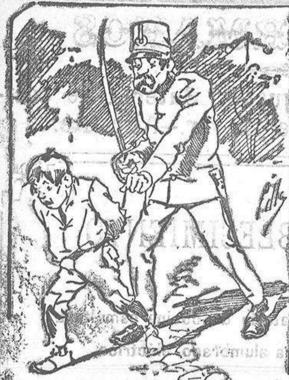
Tratamientos de la policía á nuestros vendedores cuando el número pica....

Abominan á nuestros libros..... pero los compran. con sólo indicar el nombre y dirección del que lo desea en sobre dirigido al Sr. Administrador de