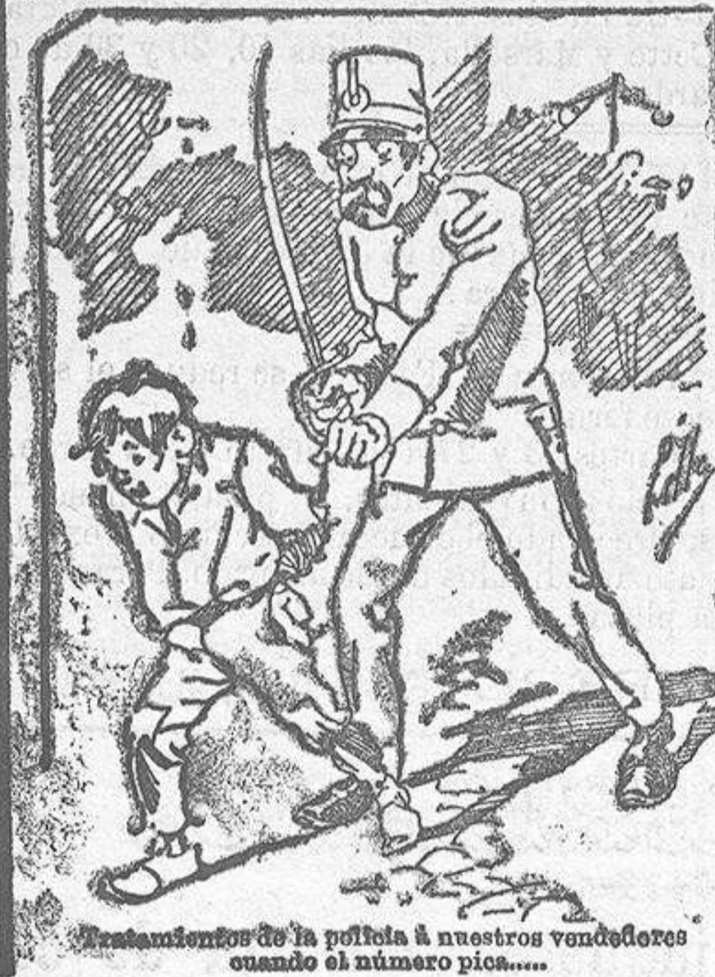
Entregamientos de la pistola á nuestros vendedores cuando el número pica.....