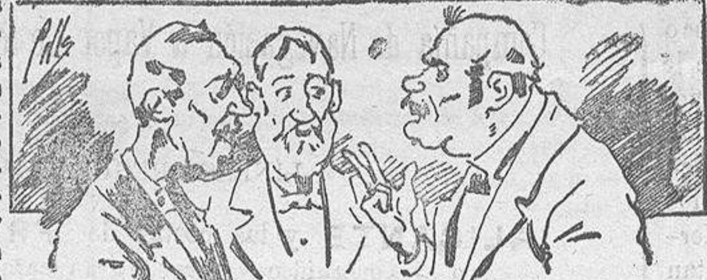
Abominan á nuestros libros..... pero los compran.

Todas las personas de gusto, curiosas é ilustradas deben pedir al Director de LA AVISPA, apartado núm. 8, MADRID, un ejemplar que se remite gratis y franqueado. Esta Revista Enciclopédica Popular publica recreaciones científicas, recetas de cocina, repostería, confitería, vinos, licores, pinturas, barnices, betunes y fórmulas para toda clase de industria, y cuantas noticias y conocimientos puedan ser beneficiosos. Cuenta además con buenos grabados, parte literaria excelente; da regalos mensuales á sus lectores con la Lotería Nacional y participaciones en la misma, á cuyo efecto compra todos los sorteos, y en una de las Administraciones más afortunadas por la suerte, billetes enteros. La suscripción y los números que se nos pidan se sirven gratuitamente á correo vuelto y franqueados, con sólo indicar el nombre y dirección del que lo desea en sobre dirigido al Sr. Administrador de