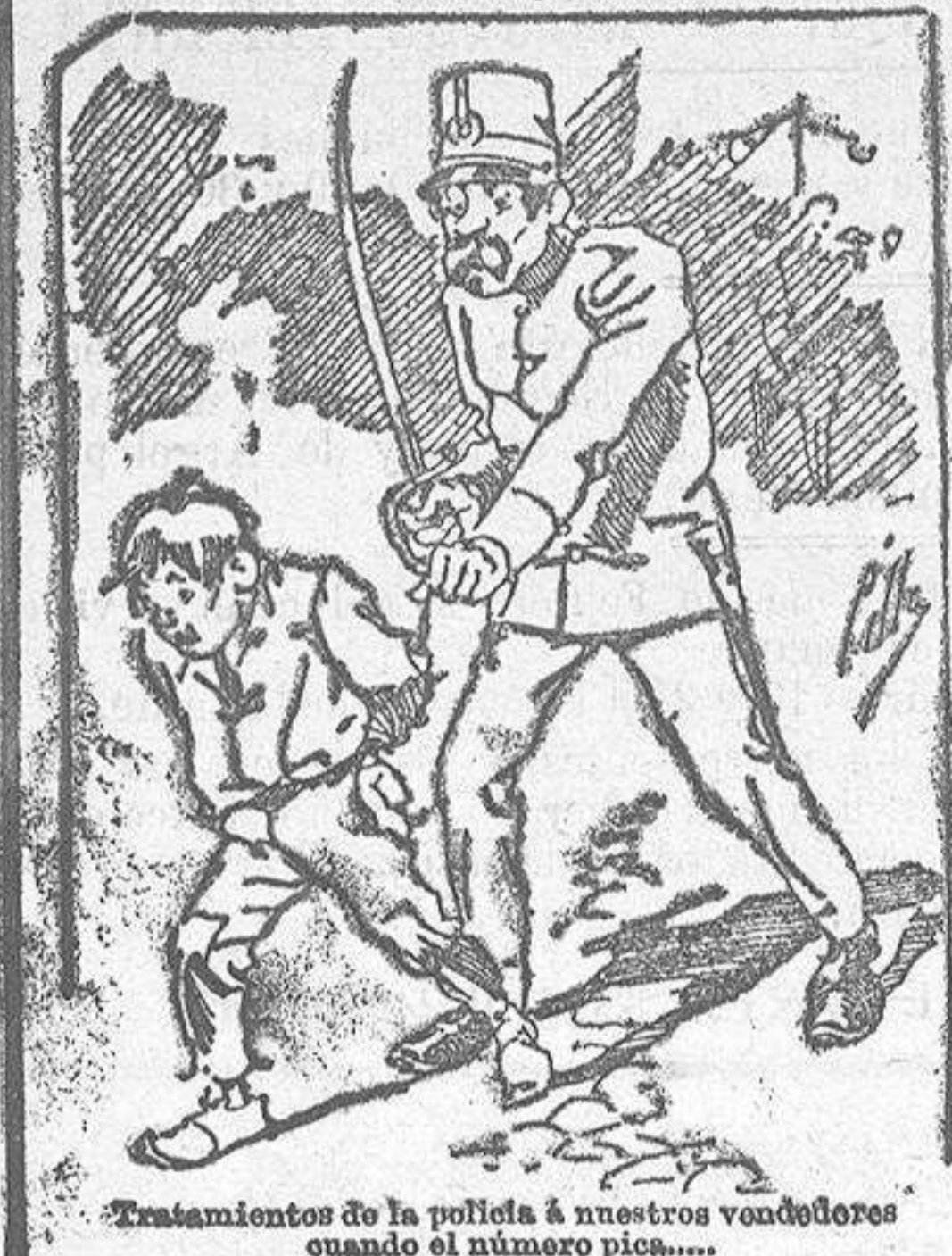
Tratamientos de la pelicia á nuestros vendedores cuando el número pica.....

También puede pedirse LA AVISPA y el CATALOGO RESERVADO en casa de nuestros corresponsales autorizados, si no se quiere escribir á la Administración.