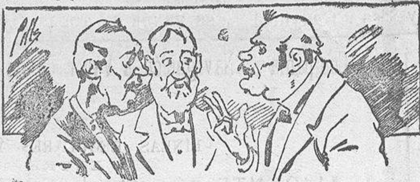
Abominan á nuestros libros....., pero los compran.

ser beneficiosos. Cuenta además con buenos grabados, parte literaria excelente; da regalos mensuales á sus lectores con la Lotería Nacional y participaciones en la misma, á cuyo efecto compra todos los sorteos, y en una de las Administraciones más afortunadas por la suerte, billetes enteros. La suscripción y los números que se nos pidan se sirven gratuitamente á correo vuelto y franqueados, con sólo indicar el nombre y dirección del que lo desea en sobre dirigido al Sr. Administrador de