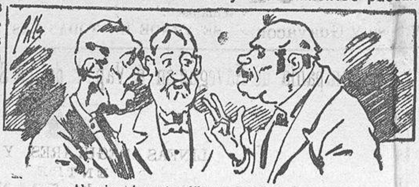
Abominan a nuestros libros..., pero los compran.

Todas las personas de gusto, curiosas e ilustradas deben pedir al Director de LA AVISPA, apartado núm. 8, MADRID, un ejemplar que se remite gratis y franqueado. Esta Revista Enciclopédica Popular publica recreaciones científicas, recetas de cocina, repostería, confitería, vinos, licores, pinturas, barnices, betunes y fórmulas para toda clase de industria, y cuantas noticias y conocimientos puedan ser beneficiosos. Cuenta además con buenos grabados, parte literaria excelente; da regalos mensuales a sus lectores con la Lotería Nacional y participaciones en la misma, a cuyo efecto compra todos los sorteos, y en una de las Administraciones más afortunadas por la suerte, billetes enteros. La suscripción y los números que se nos pidan se sirven gratuitamente a correo vuelto y franqueados, con sólo indicar el nombre y dirección del que lo desea en sobre dirigido al Sr. Administrador de