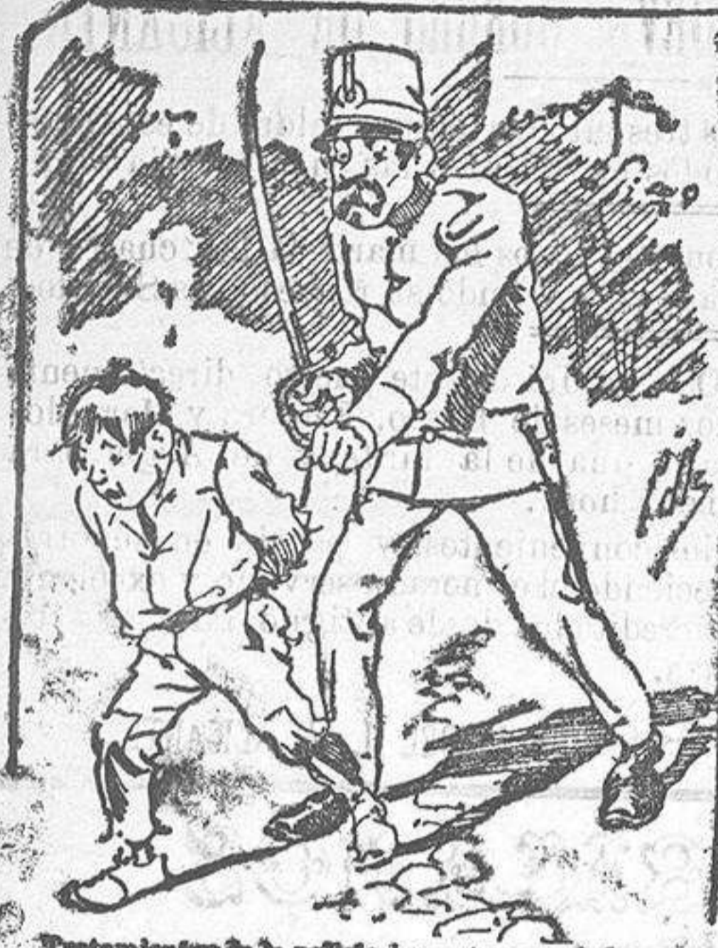
Tratamiento de la pelicia a nuestros vendedores cuando el número pica....

También puede pedirse LA AVISPA y el CATALOGO RESERVADO en casa de nuestros corresponsales autorizados, si no se quiere escribir a la Administración.