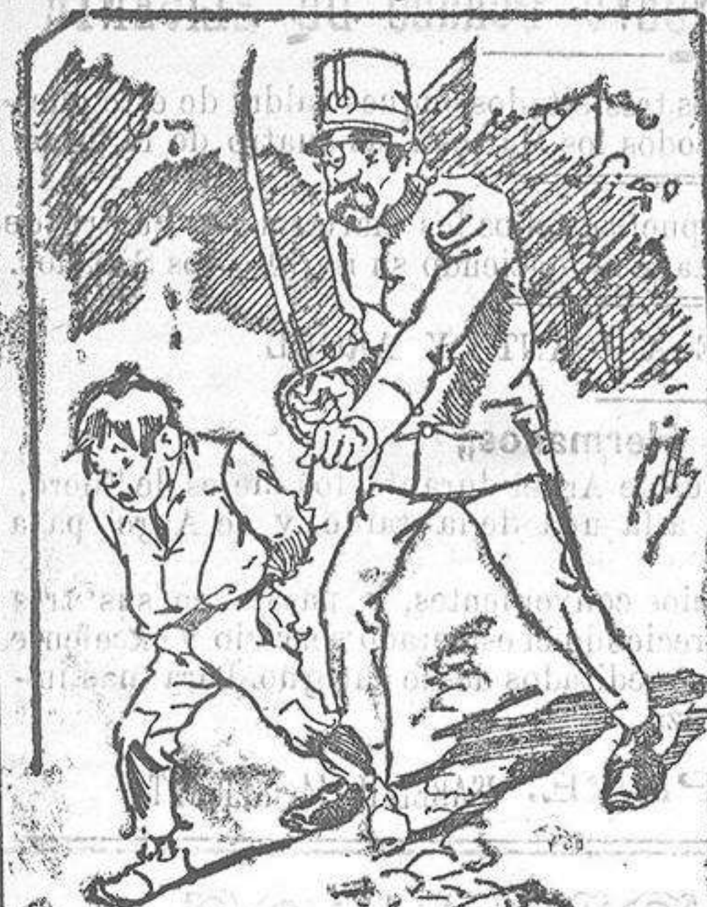
Tratamiento de la policía á nuestros vendedores cuando el número pica...

También puede pedirse LA AVISPA y el CATALOGO RESERVADO en casa de nuestros corresponsales autorizados, si no se quiere escribir á la Administración.