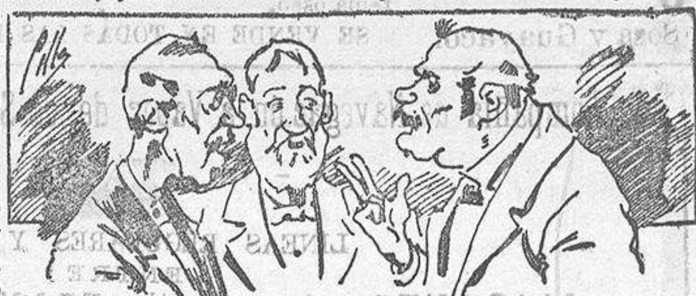
Abominan á nuestros libros... pero los compran.

Todas las personas de gusto, curiosas é ilustradas deben pedir al Director de LA AVISPA, apartado núm. 8, MADRID, un ejemplar que se remite gratis y franqueado. Esta Revista Enciclopédica Popular publica recreaciones científicas, recetas de cocina, repostería, confitería, vinos, licores, pinturas, barnices, betunes y fórmulas para toda clase de industria, y cuantas noticias y conocimientos puedan ser beneficiosos. Cuenta además con buenos grabados, parte literaria excelente; da regalos mensuales á sus lectores con la Lotería Nacional y participaciones en la misma, á cuyo efecto compra todos los sorteos, y en una de las Administraciones más afortunadas por la suerte, billetes enteros. La suscripción y los números que se nos pidan se sirven gratuitamente á correo vuelto y franqueados, con sólo indicar el nombre y dirección del que lo desea en sobre dirigido al Sr. Administrador de