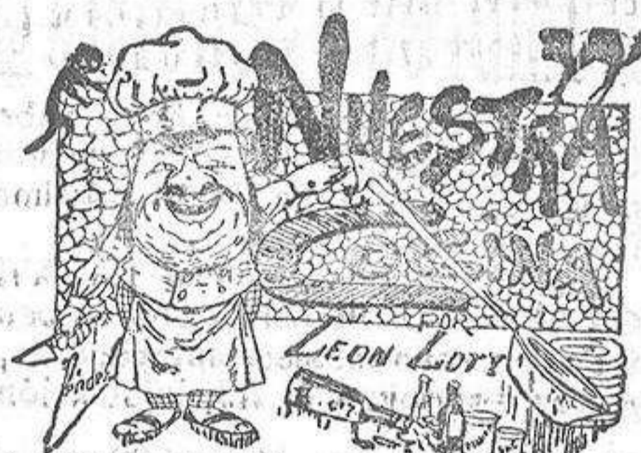
Comidas para el 13 de Enero

Ferretería, quincalla, juguetes. Bateria de cocina.—Varios artículos.—Calle Mayor.—Alicante.