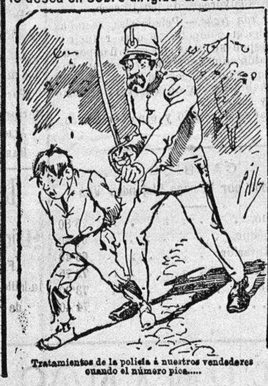
Tratamientos de la polioftal á nuestros vendedores cuando el número pide.....