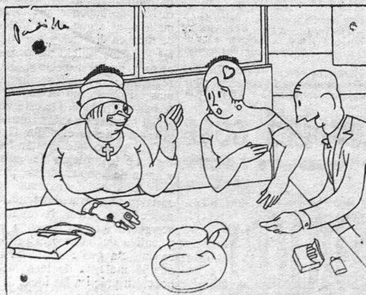
—Y usted señora el «cock-tail» ¿lo querrá con huevos verdad? —o, no. Con una buena ración de callos.

Esmero en todos los servicios Especialidad en Permanente y al agua Mayor, 43. ALICANTE