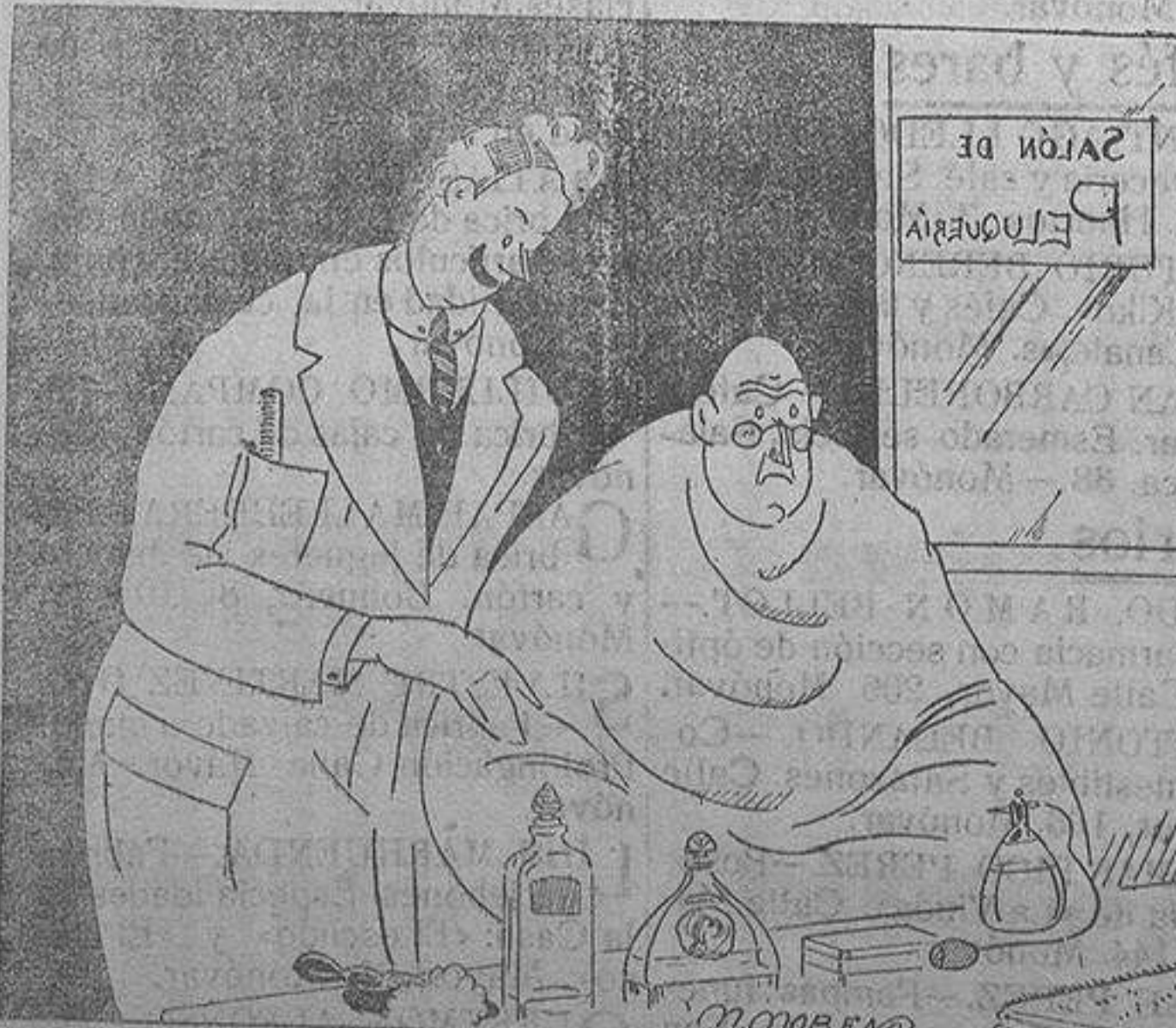
EL BARBERO DISTRAIDO. ¿Quiere el señor que le que me las puntas?