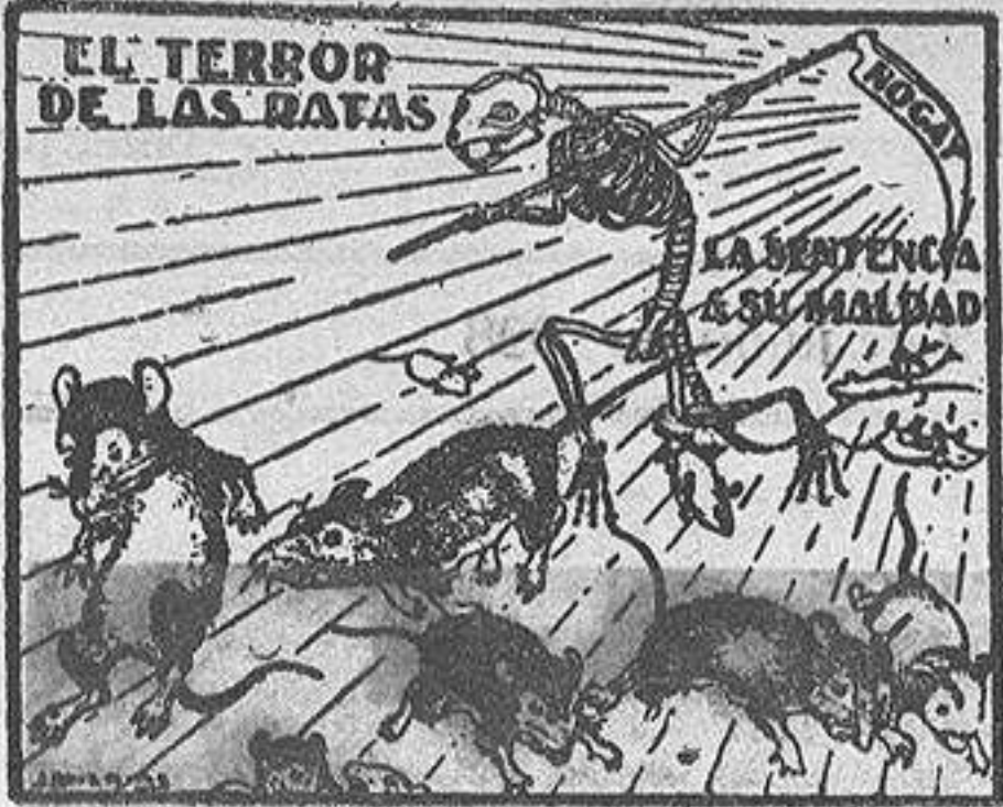
EL TERROR DE LAS RATAS

El mala-ratas «NOGAT» constituye el producto más eficaz y rápido para matar toda clase de ratas y ratones. Se vende a 30 cims. paquete y a 10 pesetas la caja de 25 paquetes, en Alicante y su provincia (Hija de R. Romero, Altamira, 5).