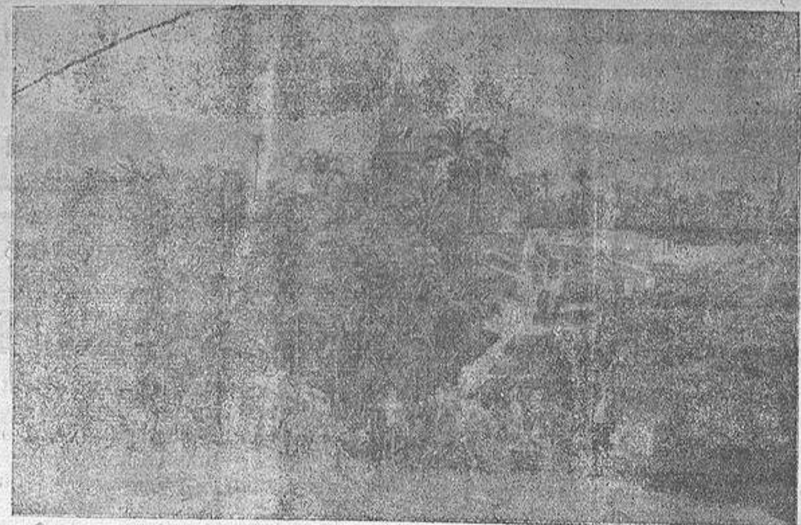
A la vista del viajero que llega lo primero que sorprende su vista es el panorama sublime de esta hondonada que eleva sus gentiles palmeras al camino como amigos cariñosos que le tienden los brazos

¿De quién es esta obra? Con razón lo hemos dejado para lo último; hacía falta una voluntad de hierro, un hombre entusiasta, un cerebro sin obstáculos, cariñoso, dispuesto siempre al favor y a la dádiva, a quien no le dolieran prendas y sabiendo luchar, esta lucha fuera para él un verdadero juguete; hablamos