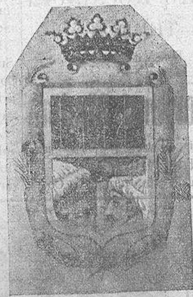
Escudo de Cox