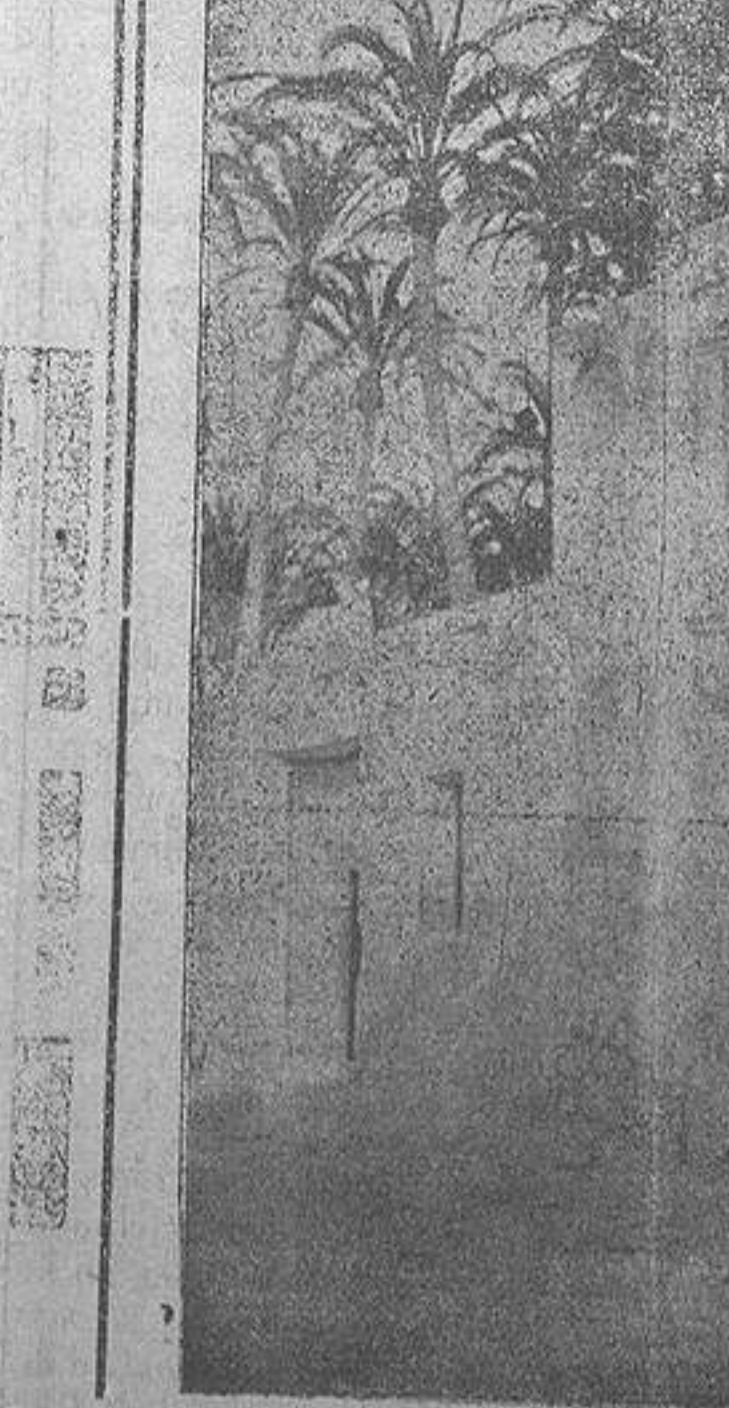
Y como no podía faltar la veneración determinada: ver la ornacina donde San Roque vive cuidado amorosamente por los vecinos de esa plaza

Mercería, Bisutería, Perfumería fina Ferreteria y Quincalla Plaza de San Juan, 1—Cox