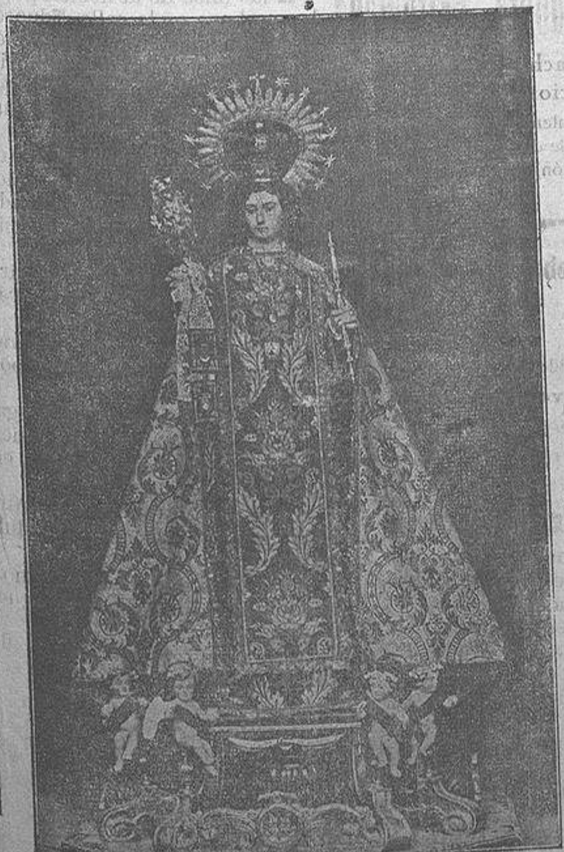
La Patrona de Cox, la Santísima Virgen del Carmen, consuelo único de los hijos de este pueblo y refugio de ellos en sus tribulaciones, cuyas bondades reparte a raudales, y su manto maternal nos cobija a todos