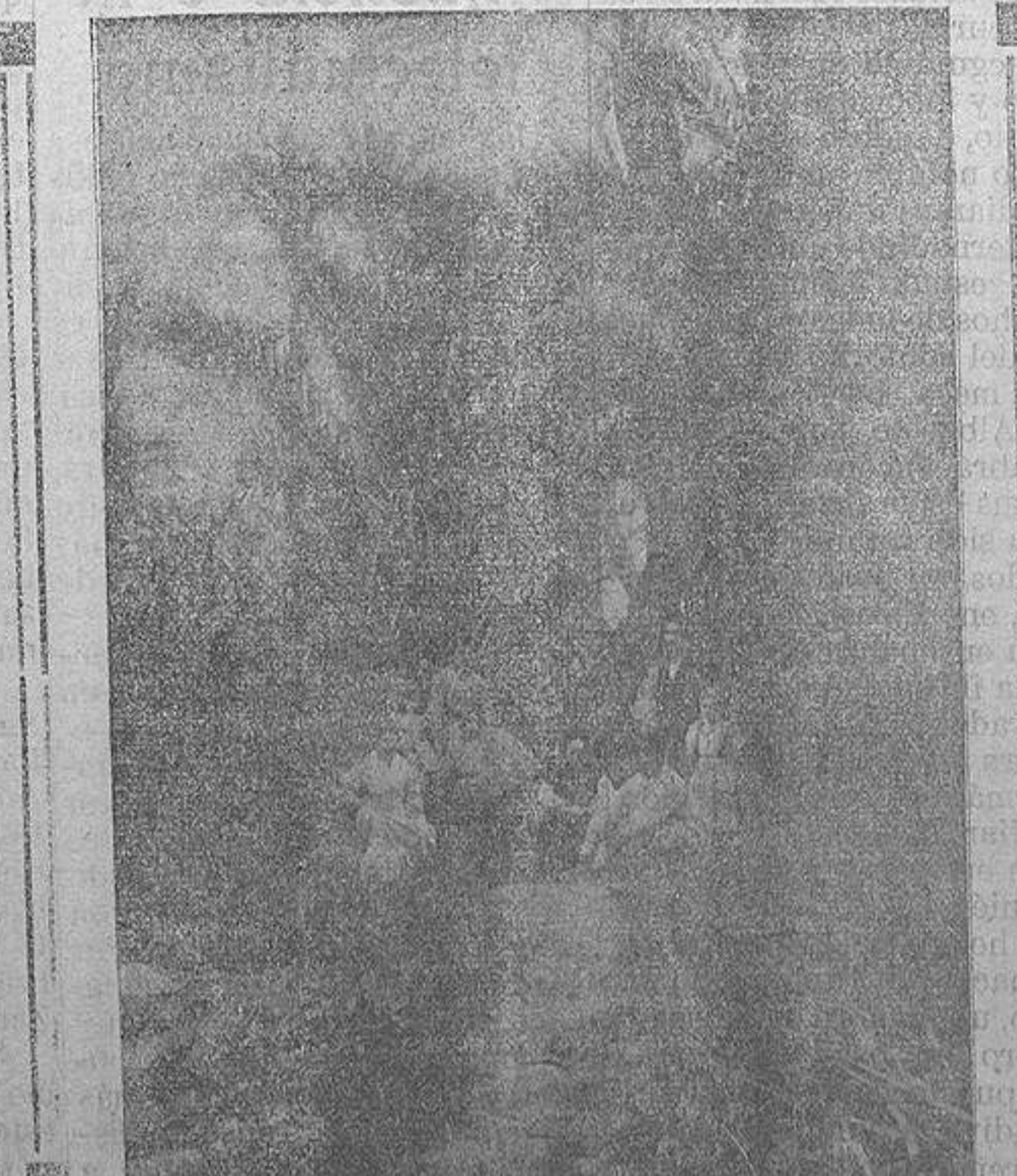
...y este rincón envidiable que en su corazón encierra, no es más que una muestra pequeña de sus bellezas