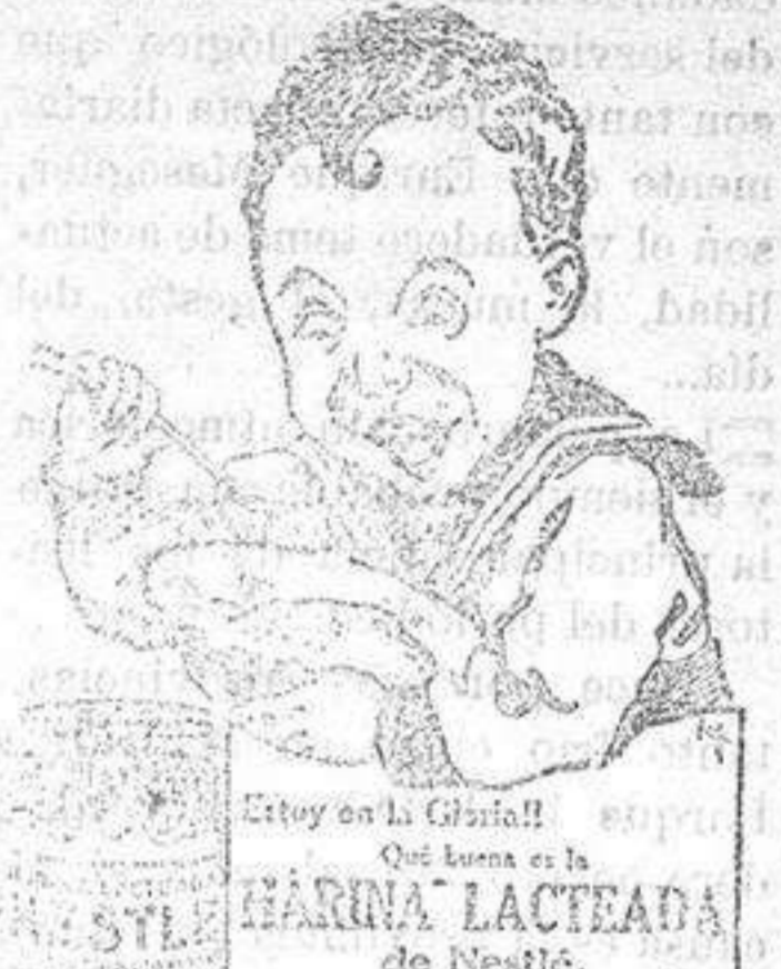
Estoy en la Gloria! Qué buena es la LACTEADA de Nestlé. Es el alimento que produce la vida.

sus enemigos políticos y de la misma nacionalidad que él. La víctima fué expulsado de Cuba por sus ideas políticas el año 26.