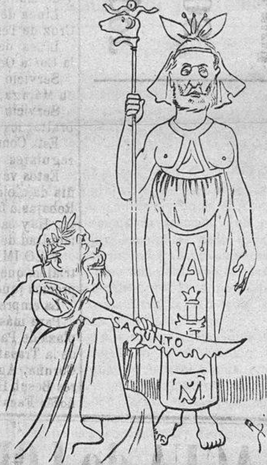
Personajes del día