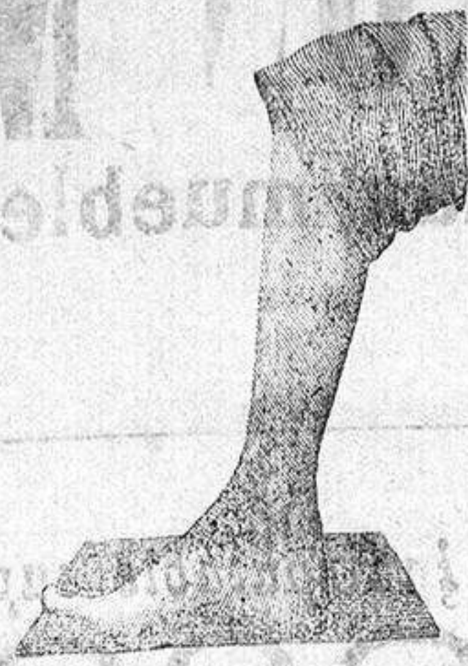
Después de 15 días de tratamiento